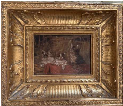
Lot 129 ADAM (XXe siècle) Chatons

Huile sur panneau, signée en bas à droite H. 10 cm x L. 14 cm (Craquelures)