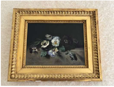
Lot 113 HENRIETTE DE LONGCHAMP (1818 - ?) Roses et Pensées

Deux huiles sur toile. Signées en bas à gauche. H. 24 cm x L. 30 cm (à vue) Encadrées.