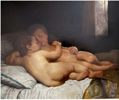
Lot 127 WILMAN (XXe siècle) Enfants endormis

Huile sur toile, signée en bas à gauche H. 50,5 cm x L. 61 cm