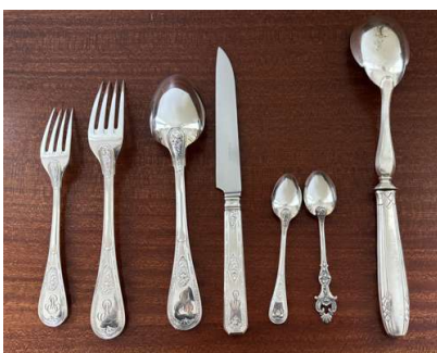
Lot 86 PARTIE DE SERVICE RECOMPOSÉE

en métal argenté Dans un meuble argentier de style Louis XV H. 80,5 cm x L. 65 cm x P. 45,5 cm (en l'état).