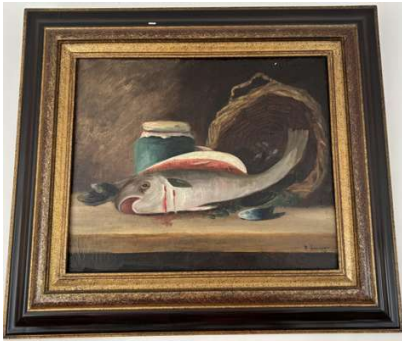
Lot 82 R. BOINGER Nature morte au poisson, au pot et au panier

Huile sur toile Signée en bas à droite H. 44,5 cm x L. 53,5 cm Encadrée.