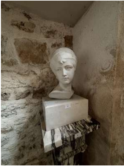
Lot 47 ÉCOLE MODERNE Tête de femme de trois quart.

Marbre blanc sur une base de forme rectangulaire. H. 43 cm (En l'état).