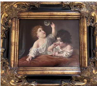
Lot 130 ANDERSON (XXe siècle) Enfant faisant des bulles

Huile sur panneau, signée en bas à droite H. 18,5 cm x L. 23,5 cm (à vue)