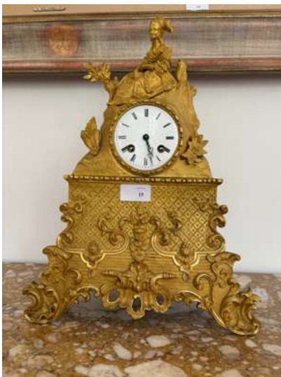
Lot 15 PENDULE À L'ÉLÉGANTE

en bronze ciselé et doré. Cadran émaillé blanc indiquant les heures en chiffres romains. Milieu du XIXe siècle. Hauteur: 39 cm (Manques, en l'état).