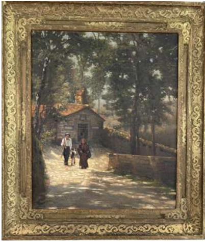
Lot 52 Georges CLAEYS (XXe siècle) Sur le chemin.

Huile sur panneau. Signée en bas à droite. H. 71,5 x L. 58 cm (à vue) Encadré.