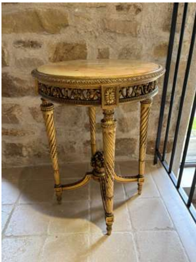
Lot 53 PETIT GUÉRIDON

en bois sculpté et doré, le plateau en marbre beige. Style Louis XVI, dans le goût d'Adam WEISWEILER H. 72 x D. 52 cm (Manques, restaurations, en l'état).