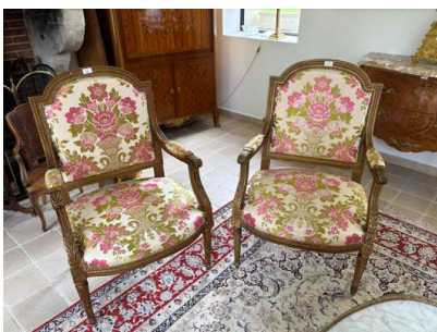
Lot 16 PAIRE DE FAUTEUILS

En bois sculpté et doré, les dossiers dits "à chapeau de gendarme", la ceinture arrondie sur des pieds fuselés et rudentés. Style Louis XVI. Garniture de soie aux pots fleuris. Hauteur: 99 cm (Accidents, manques, en l'état).