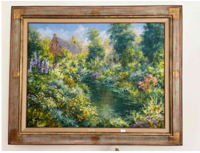
Lot 13 ROGER BOLZONELLO (né en 1944) Paysage fleuri

Huile sur toile Signée en bas à gauche H. 47 cm x L. 114 cm (à vue) Encadrée.