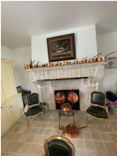
Lot 83 LOT DE CUIVRES