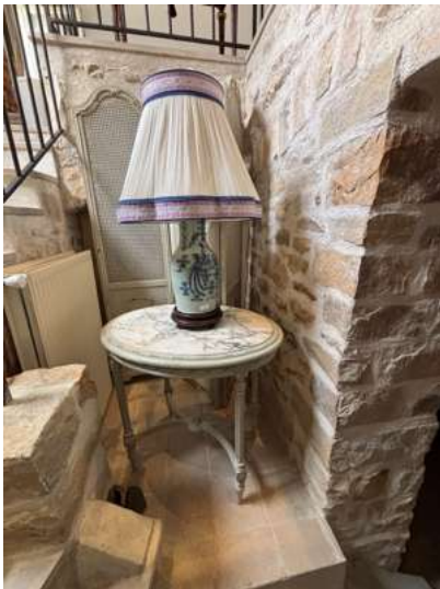
Lot 48 TABLE OVALE

en bois sculpté et peint gris. Plateau de marbre veiné blanc. Style Louis XVI. H. 74 cm x L. 78 cm x P. 59 cm On y joint un paravent en bois sculpté, laqué gris et canné à trois feuilles de style Louis XVI. (Quelques chocs et restaurations d'usage, en l'état).