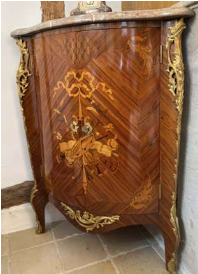
Lot 58 ENCOIGNURE

en bois de placage à décor marqueté. La façade ouvrant par deux vantaux, les montants et pieds cambrés.