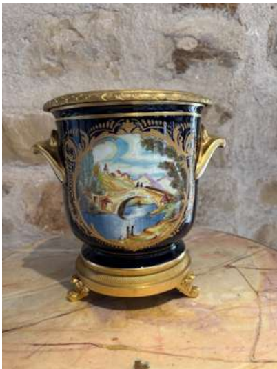
Lot 54 CACHE-POT

en porcelaine et garniture de bronze doré, à décor polychrome d'une scène pittoresque dans un cartouche doré sur fond bleu. Style Louis XVI H. 23,5 cm (Usure au décor et à la patine, en l'état).