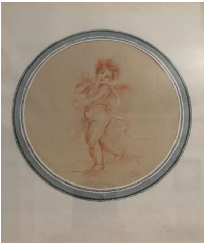
Lot 128 ENSEMBLE DE PIÈCES ENCADRÉES :

- Ecole française du XIXe siècle Puttis Paire de sanguine sur papier à vue circulaire, monogrammées H. 16 cm x L. 16 cm (à vue)