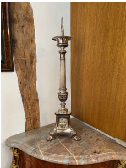
Lot 59 PIQUE-CIERGE