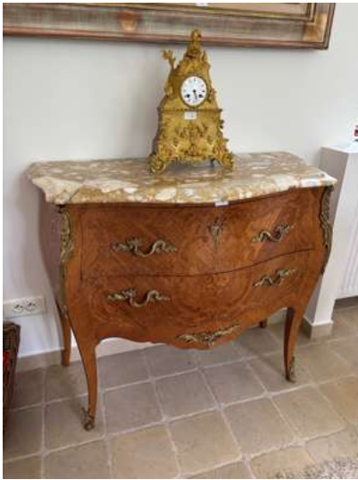
Lot 14 COMMODE D'ENTRE-DEUX

En bois de placage à décor marqueté, la façade ouvrant par deux tiroirs. Les montants et les pieds cambrés. Style Louis XV Plateau de marbre brèche. Garniture de bronzes dorés. H. 85 x L. 98 x P. 46 cm (Quelques manques et petits accidents, en l'état).