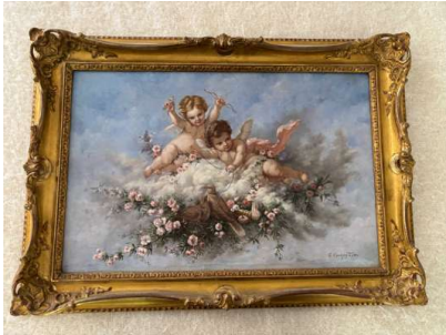
Lot 114 G.CAMINADE (XIXe ou XXe siècle) Putti dans les cieux.

Huile sur toile. Signée en bas à droite. H. 38 cm x L. 60 cm (à vue). Encadré.