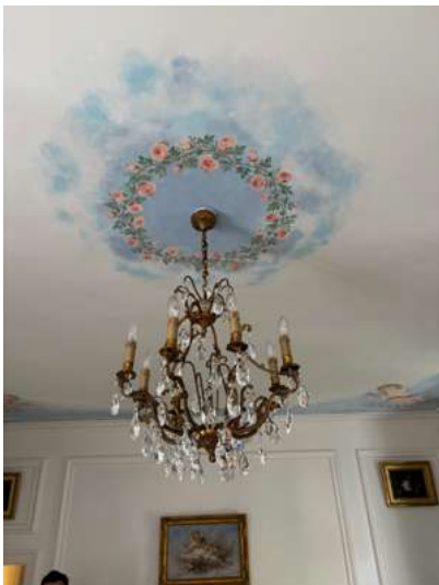
Lot 115 PETIT LUSTRE CAGE

à huit feux, en bronze doré agrémenté de pampilles en verre. Style Louis XV. H. totale: environ 55 cm Electrifié. (En l'état).