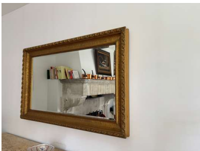
Lot 84 MIROIR RECTANGULAIRE

en bois sculpté et doré. Style Louis XVI. H. 84 x L. 134 cm (en l'état).