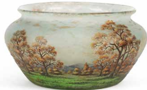
4 DAUM NANCY Grande coupe circulaire. En verre multicouche bleu nuancé, à décor gravé à l'acide et émaillé d'un paysage arboré, sur fond montagneux. Signature émaillée 'Daum Nancy'. H. 13,5 - D. 24 cm H. 5 1/4 - D. 9 1/2 in. (Traces de salissures, micro-égrenures sous la base) A large circular cup in multilayered glass with acid-etched and enameled decoration. Signed. 1 000 - 1 500 €