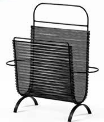
54 MATHIEU MATÉGOT (1910-2001)

Porte-revues, modèle créé circa 1951. Structure en métal tubulaire laqué noir, enserrant une feuille de rigiture laquée noir. H. 45 - L. 45 - P. 14 cm H. 17 3/4 - W. 17 3/4 - D. 5 1/2 in.