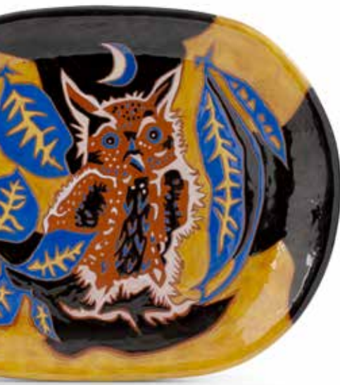
51 JEAN LURÇAT (1892-1966) & SANT VICENS (Atelier)

Hibou Grand plat ovalisé, circa 1950-1960. En céramique émaillée, à décor polychrome d'un hibou parmi des branches sur fond jaune et noir. Signé 'Dessin J Lurçat Sant-Vicens C.V.A.' et numéroté 6/100 au revers.