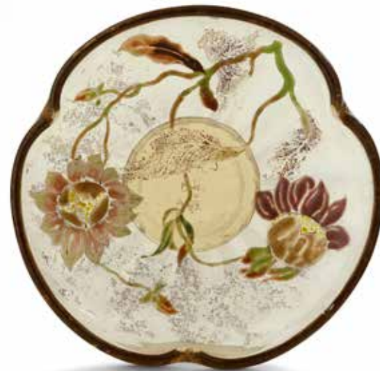
3 ÉMILE GALLÉ (1846-1904) Coupe trilobée. En verre légèrement fumé, à décor émaillé polychrome et or de chrysanthèmes avec cabochons en application. Signature émaillée 'E. Gallé Nancy Déposé'. H. 4,3 cm - L. 17,6 cm H. 1 11/16 - W. 6 15/16 in. (Usures de dorure, légères rayures sous la base) A cup in glass, with enameled decoration and applied cabochons. Signed. 800 - 1 200 €