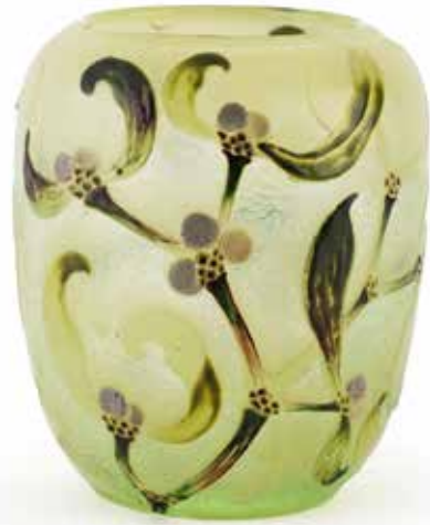
2 ÉMILE GALLÉ (1846-1904) Vase 'Gui', circa 1900. En verre teinté vert d'eau, à décor gravé à l'acide et émaillé vert et or de branches de gui sur fond givré. Signature gravée à l'acide 'Gallé' et cachet interne. H. 15,5 cm H. 6 1/8 in. (Petites salissures, légères rayures et micro-égrenures sous la base) A 'Gui' vase, c. 1900, in tinted glass, with acid-etched and enameled decoration. Signed and stamped. 1 500 - 2 000 €