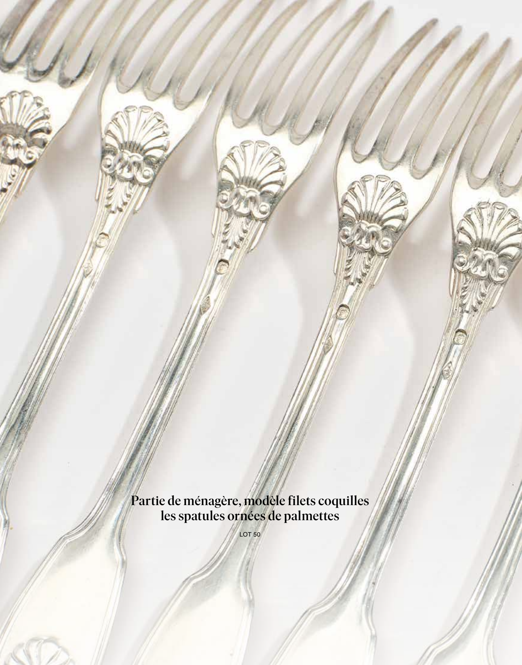
Partie de ménagère, modèle filets coquilles les spatules ornées de palmettes