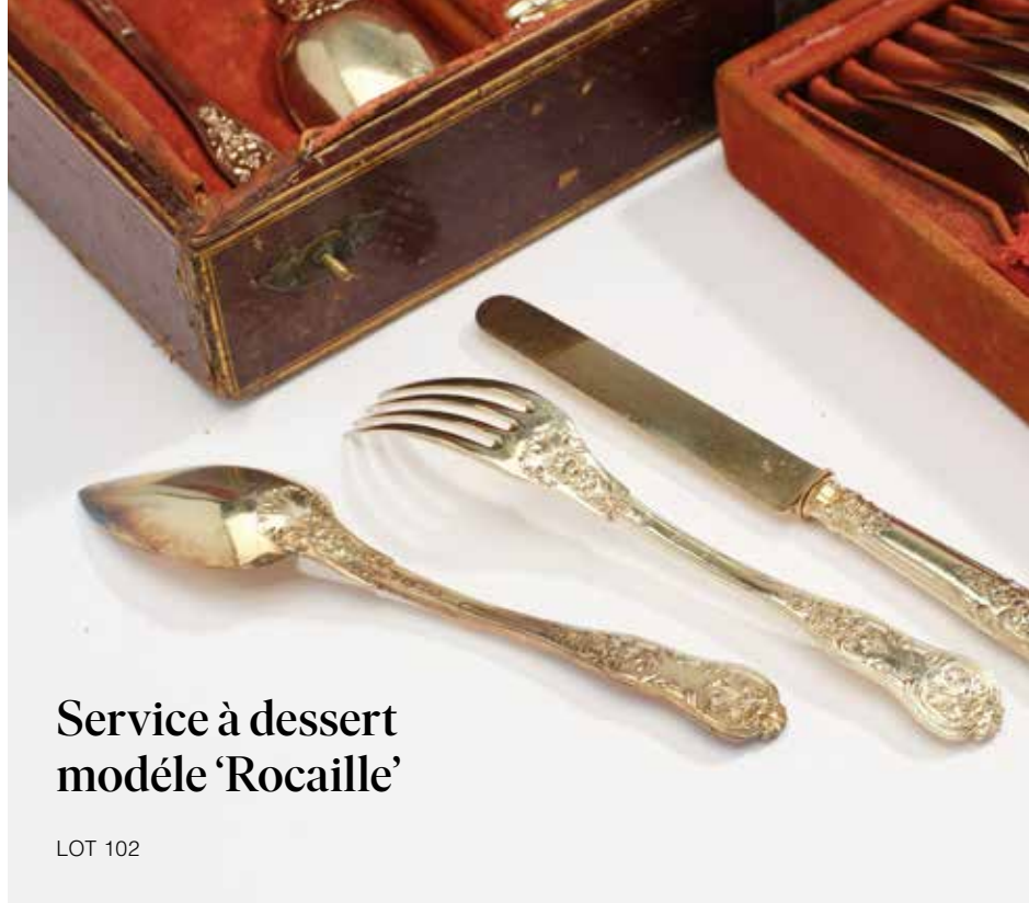
Service à dessert modèle 'Rocaille'

Le XIX e siècle marque un tournant décisif : les progrès techniques, en particulier l'électrolyse, permettent une production plus sûre et plus largement diffusée. De grandes maisons d'orfèvrerie surent tirer parti de ces innovations, tout en puisant dans le vocabulaire formel des siècles passés. Filets, contours ondulés, enroulements et motifs ornementaux s'y déploient avec mesure, inscrivant le vermeil dans un répertoire à la fois hérité et renouvelé.