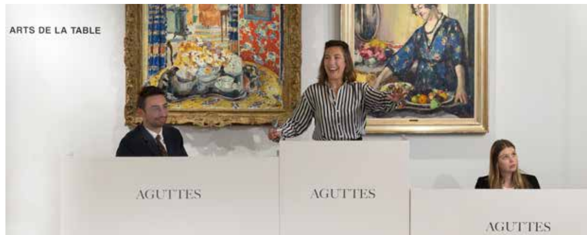
Vente Arts classiques, décembre 2023