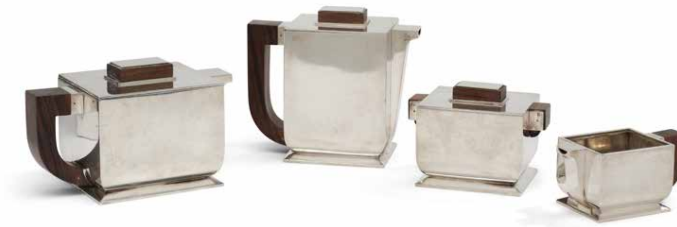
Service à thé & café, modèle réalisé par Valéry Bizouard pour Tétard Frères