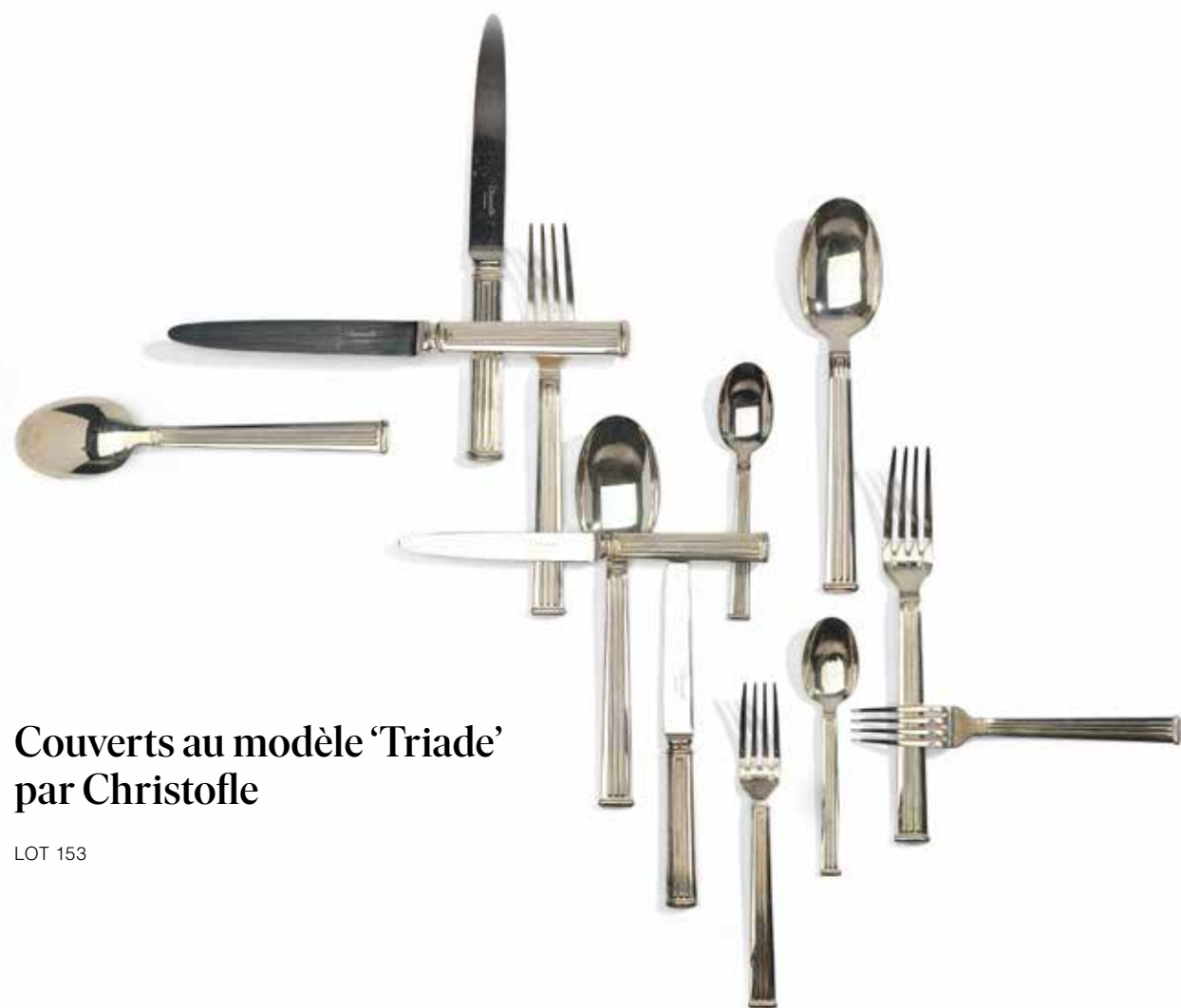
Couverts au modèle 'Triade' par Christofle

« ... la rigueur de la ligne met en valeur la pureté des formes »