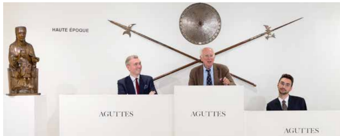
Vente Haute époque, juillet 2025