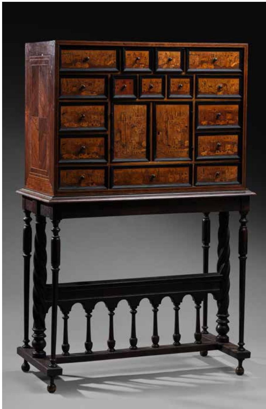
189 CABINET AUGSBOURGEOIS rectangulaire entièrement marqueté. La face à seize tiroirs et deux vantaux centraux à décor de ruines, de cuirs découpés et végétaux. Côtés et dos plaqué de bois précieux. Allemagne, Augsbourg, XVII e siècle. Hauteur : 59,5 cm - Largeur : 82,5 cm Profondeur : 37 cm (Bel état général, restaurations, transformations) Il repose sur un piètement spécialement adapté que nous joignons. Hauteur totale : 137 cm