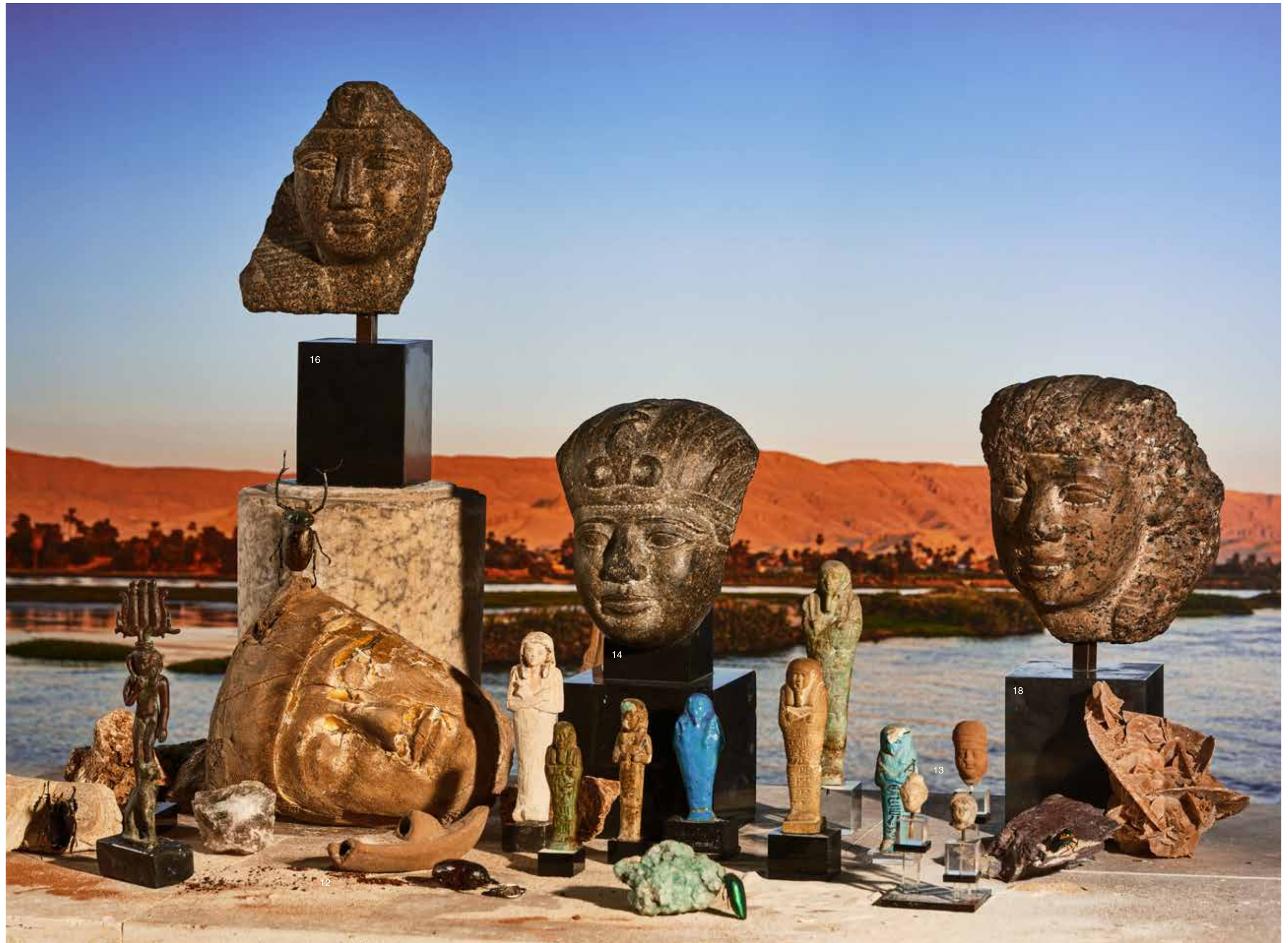
12 LAMPE À HUILE en terre cuite en rare forme de bateau. Époque Romaine Longueur: 14,2 cm (Accidentée)