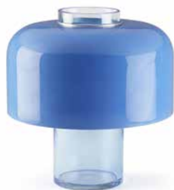
65 CARLO NASON (né en 1935) & MAZZEGA (Éditeur) Lampe à poser formant vase, modèle 'LT 226', circa 1960. Fût formant vase et diffuseur en verre de Murano bleu. H. 37 - D. 36 cm H. 14 5/8 - D. 14 1/8 in. A blue Murano glass table lamp/vase, model 'LT 226', c. 1960.