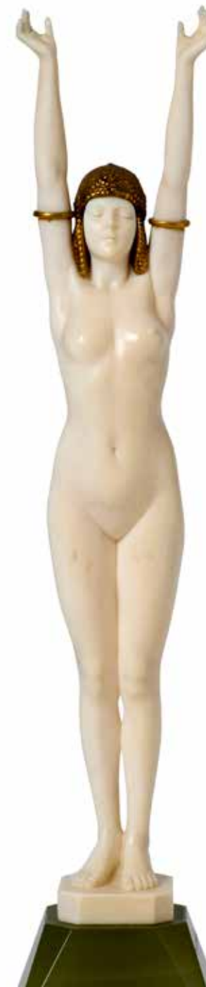
détail du lot 14