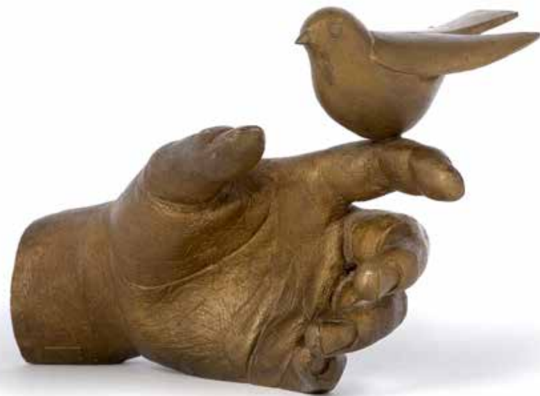
Francois-Xavier Lalanne (1927 - 2008) Main de Roman , circa 1993 Vendu 82 000€ en juin 2025