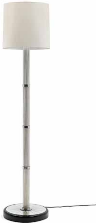
138 OSVALDO BORSANI (1911-1985) & TECNO (Éditeur)

Bureau, circa 1975. Piètement en fonte d'aluminium partiellement laquée noir, supportant un plateau en bois laqué noir à découpe centrale accueillant un sous-main en cuir noir, ouvrant par deux tiroirs latéraux en ceinture. Pastilles de l'éditeur.