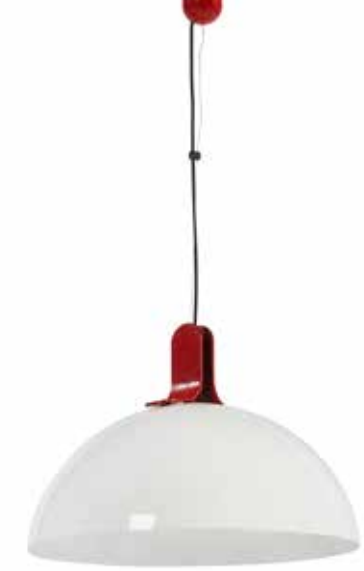
60 ANNÉES 1970 Suspension. Déflecteur hémisphérique en plexiglass blanc retenu par deux éléments d'applique en métal laqué rouge, cache-bélière en métal laqué rouge. H. max. 127 - D. 65 cm H. 50 - D. 25 5/8 in. A ceiling lamp, white plexiglass deflector, red lacquered metal elements. 300 - 500 €