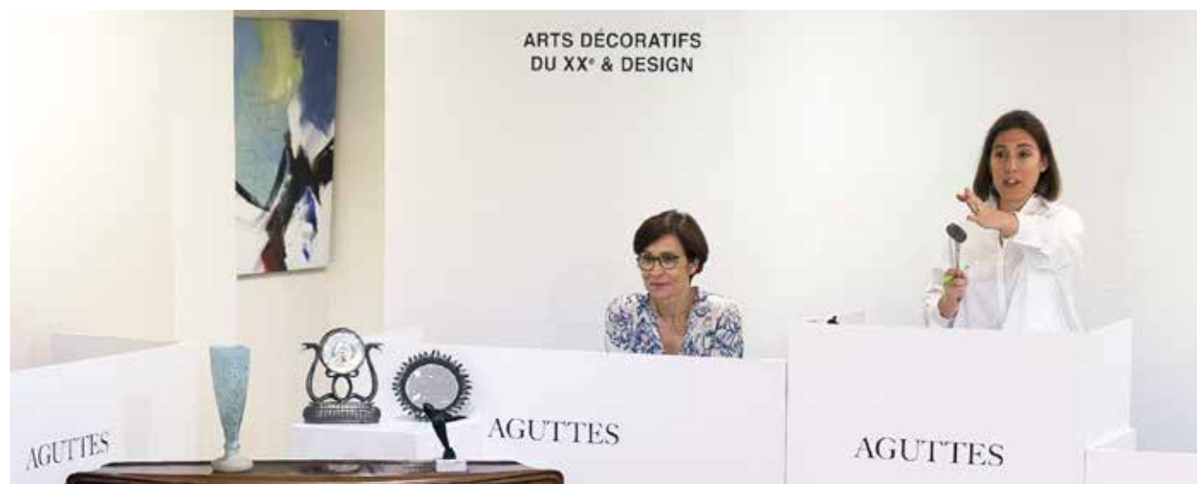
Vente Arts décoratifs du XX e & Design, juin 2025