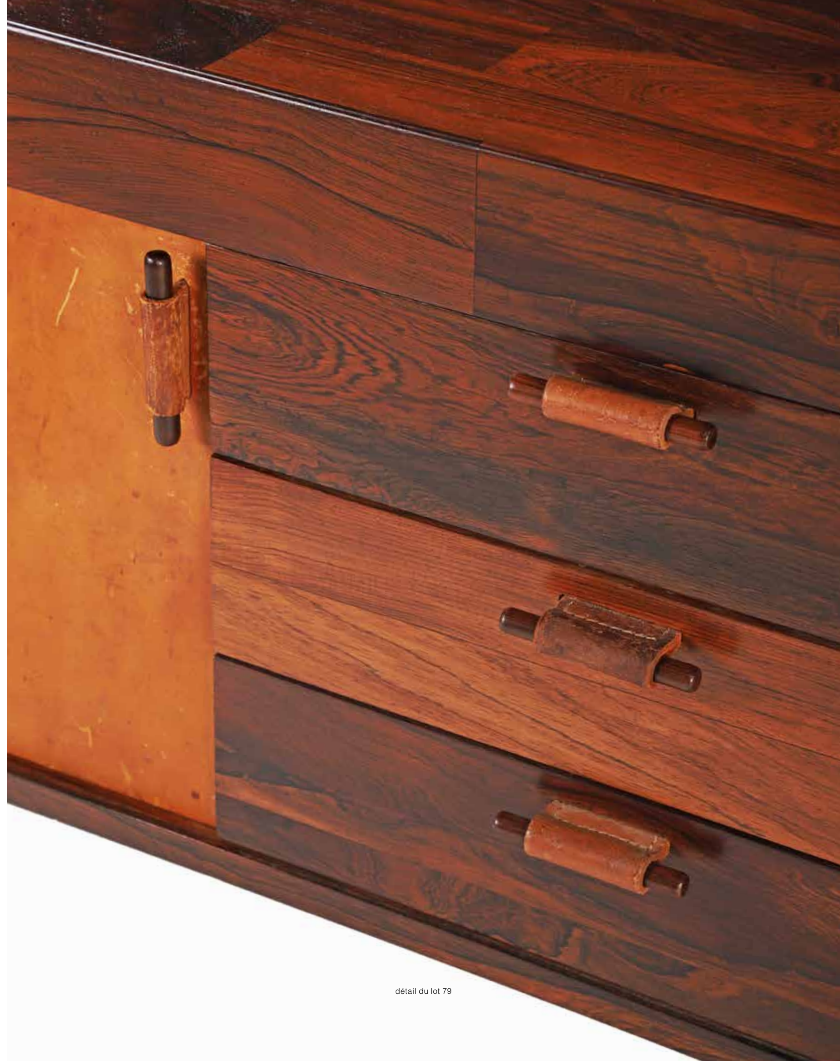
détail du lot 79

If a customer feels that they have not received a satisfactory response, they are advised to contact the head of the relevant department at AGUTTES directly, as a matter of priority. If no response is received within the specified time, the customer may contact the customer service department at serviceclients@aguttes.com . This department is part of the AGUTTES Quality Department.