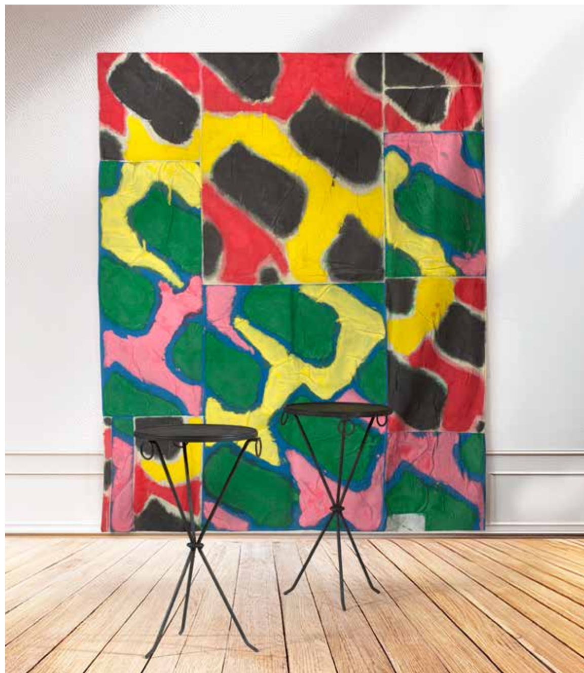
Jean-Michel Frank (1893 - 1941) & Maison Comté (éditeur). Paire de guéridons, modèle créé circa 1935, fer noirci, H. 69 cm – D. 39 cm. En vente le 9 avril Claude Viallat (né en 1936). Acrylique sur toile, circa 1990, 190 x 150 cm. En vente le 10 avril