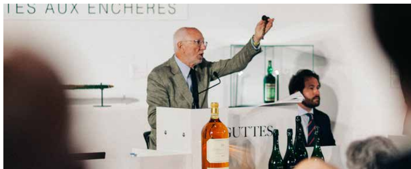
Vente officielle du Tour Auto 2021 ayant totalisé plus de 2 millions d'euros