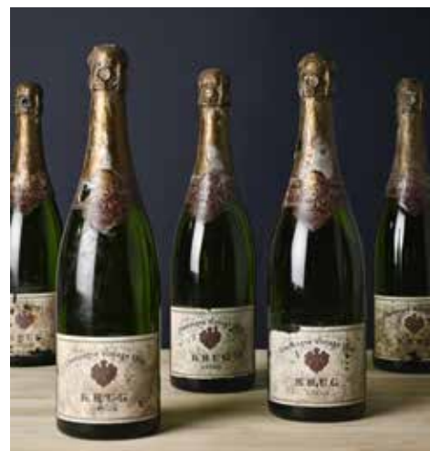
Composition Champagne Krug 1969 (lots 6 à 15)