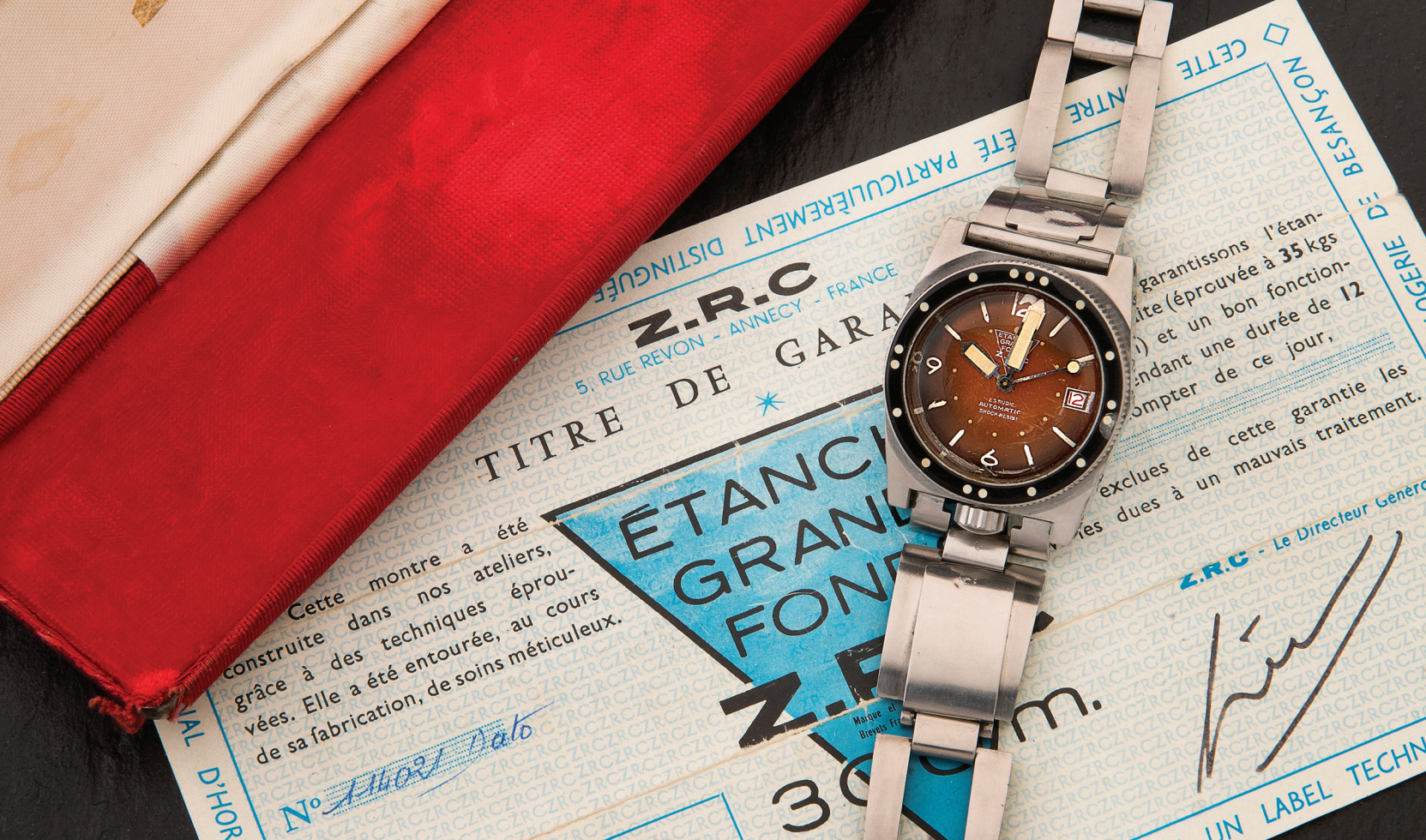
ZRC Grands fonds, vers 1960. Adjugée 8 190 € TTC