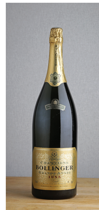
278 1 Jéroboam Champagne Grande année 1985, Bollinger Estimation : 1 000 - 1 200 €