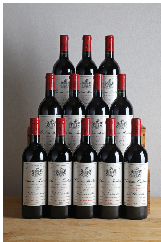
77 12 bouteilles Château Montrose, 1990, dans leur caisse bois d'origine Estimation : 4 000 - 4 500 €

+33 (0)1 47 45 91 50 - nourry@aguttes.com