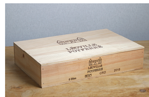
227 6 bouteilles Château Léoville Poyferré, 2015 Caisse bois d'origine Estimation : 390 - 450 €