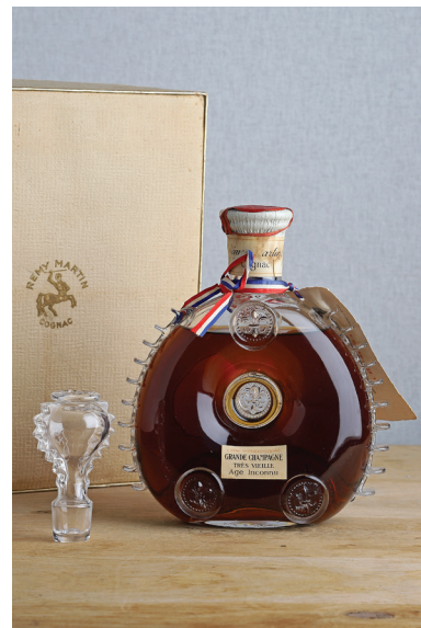
99 1 bouteille Cognac Grande Champagne très vieille (âge inconnu) Rémy Martin en carafe Baccarat avec coffret Estimation : 1 200 - 1 400 €