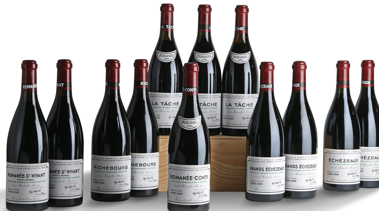
12 bouteilles provenant du Domaine de la Romanée-Conti, 2000. Adjugées 45 880€ TT

Bruxelles Charlotte Micheels +32 (0)2 311 65 26 - micheels@aguttes.com