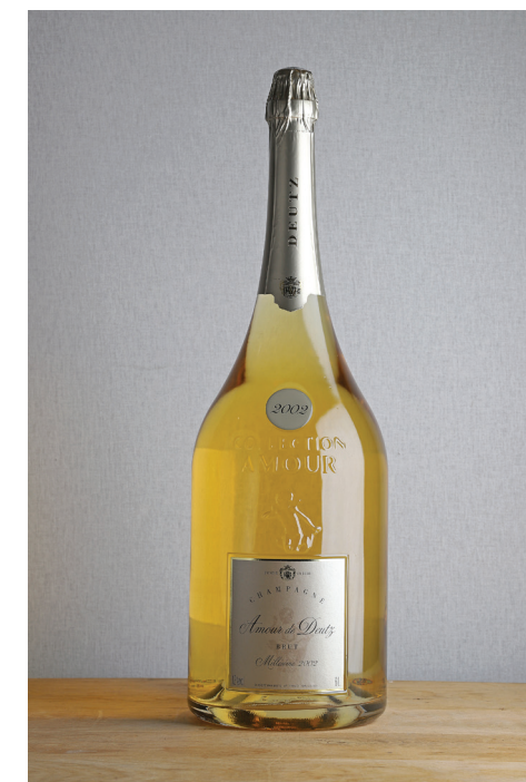
138 1 bouteille Matusalem Champagne brut Amour de Deutz, Collection Amour, 2002, William Deutz Estimation : 2 800 - 3 300 €