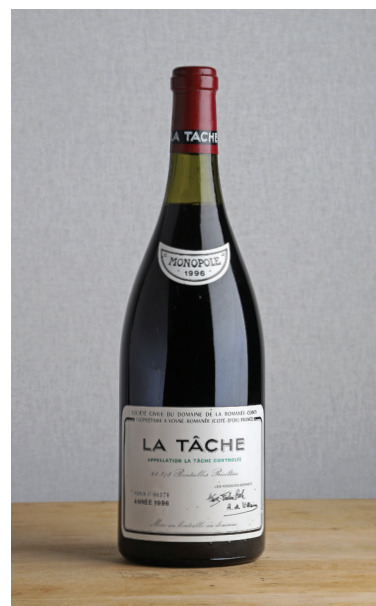
133 1 Magnum La Tâche (Grand cru) 1996 Domaine de la Romanée-Conti Estimation : 7 000 - 8 000 €