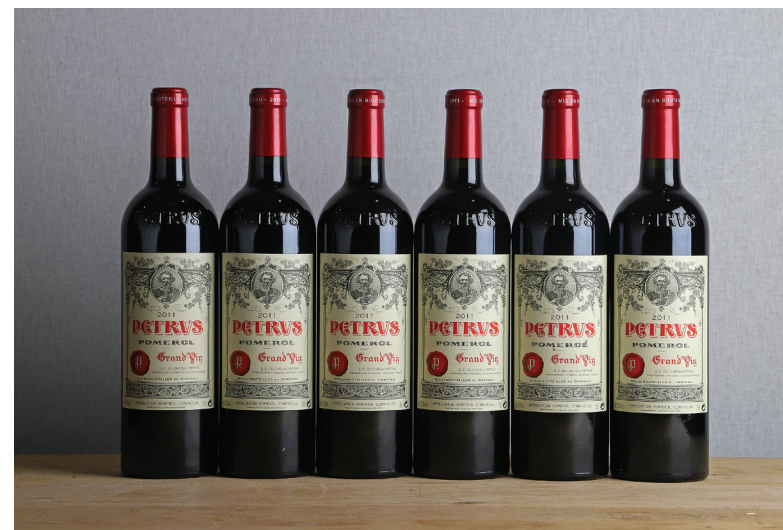
137 6 bouteilles Petrus 2011, Pomerol Estimation : 9 000 - 10 000 €