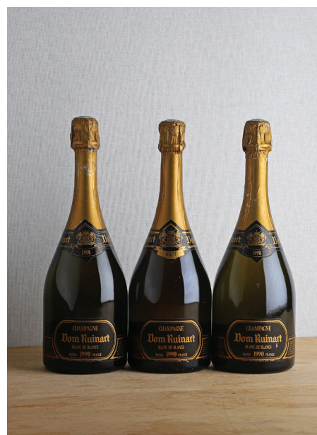
158 3 bouteilles Champagne brut Dom Ruinard, 1990 Estimation : 500 - 550 €