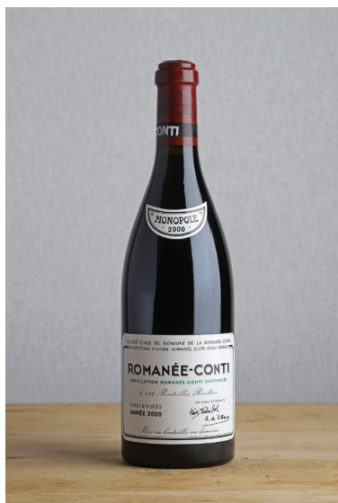
135 1 bouteille Romanée-Conti (Grand cru) 2000 Domaine de la Romanée-Conti Estimation : 10 000 - 12 000 €