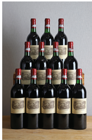
128 12 bouteilles Château Lafite-Rothschild dans leur caisse bois d'origine Estimation : 4 800 - 5 400 €