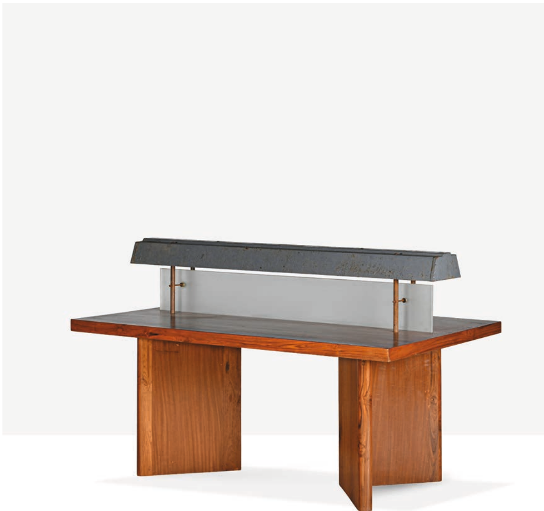
Pierre Jeanneret (1896-1967) Table éclairante