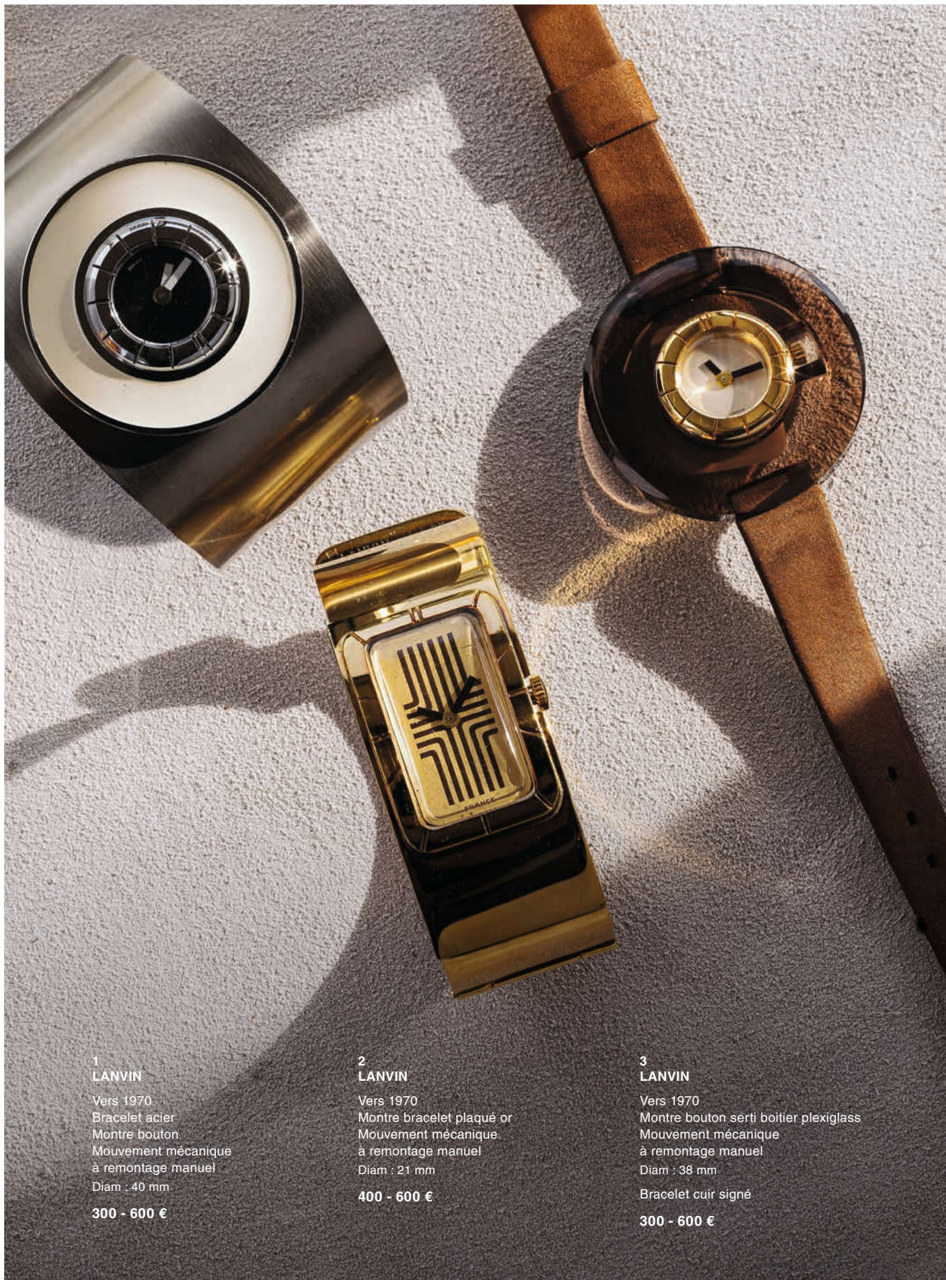
1 LANVIN Vers 1970 Bracelet acier Montre bouton Mouvement mécanique à remontage manuel Diam : 40 mm 300 - 600 €