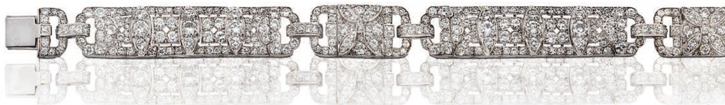
Lacloue Bracelet « ruban » diamants Vers 1925