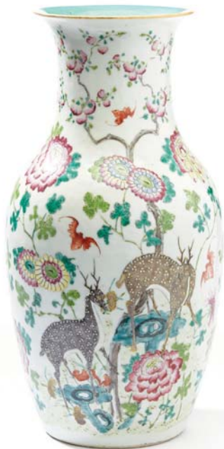
20 CHINE VERS 1900

Vase balustre en porcelaine et émaux de la famille rose, à décor d'un couple de daims et de chauves-souris, parmi des pivoinies en fleurs, chrysanthèmes et pêches de longévité.