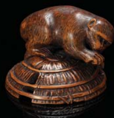
223 JAPON PÉRIODE MEIJI (1868-1912)