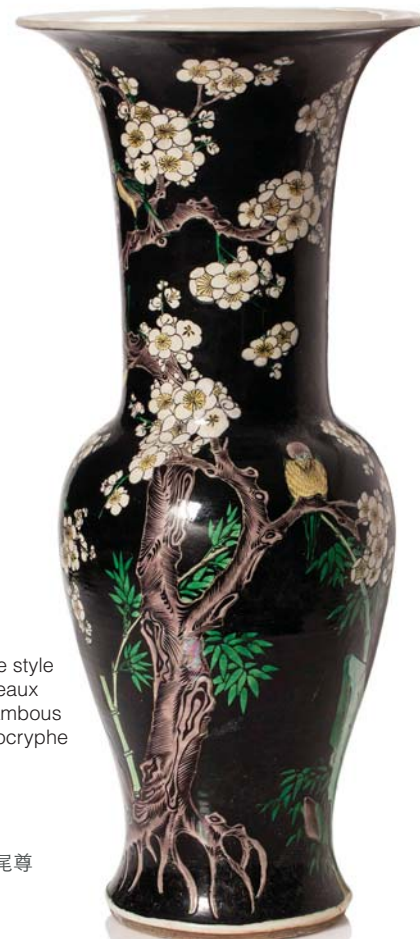
85 CHINE XX E SIÈCLE

Vase yen-yen en porcelaine et émaux de style famille verte sur fond noir, à décor d'oiseaux perchés sur un prunus en fleurs, des bambous s'élevant derrière un rocher. Marque apocryphe Chenghua sur la base. (Petit fêle sur la base 底部轻微有裂)