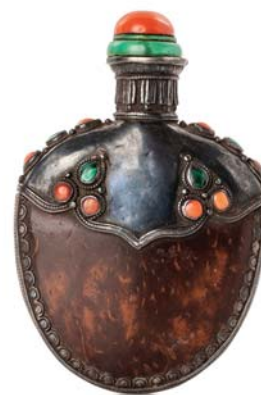
139 TIBET XIX e SIÈCLE

Flacon tabatière de forme gourde en coco et argent, orné de cabochons de corail et malachite, avec bouchon en corail.