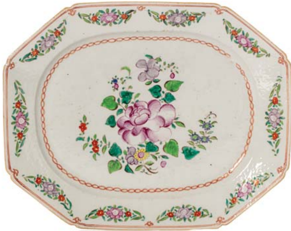
87 COMPAGNIE DES INDES Grand plat à décor de fleurs. Dim. 33.5 x 41.8 cm 中国 东印度公司 折枝花卉大盘