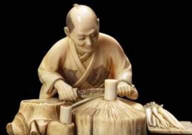
173 JAPON PÉRIODE MEIJI (1868-1912)