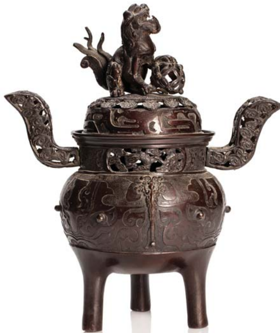
243 JAPON FIN XIX e SIÈCLE

Brûle-parfum tripode couvert en bronze de patine brune, la panse et le couvercle partiellement ajouré à décor de motifs archaisants chinois, anse et col ajourés de motifs stylisés, un shishi formant la prise.