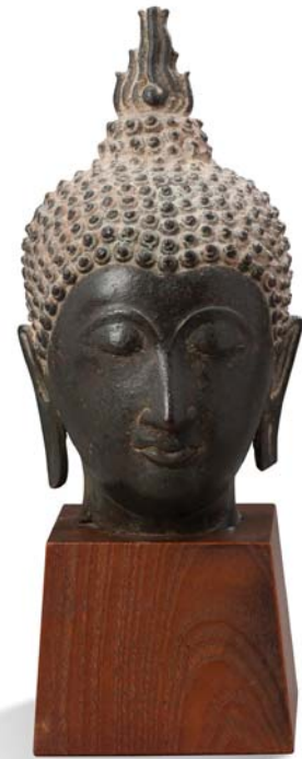
144 THAILANDE XVII E SIÈCLE

Tête de bouddha en bronze, les yeux mi-clos et esquissant un léger sourire, la coiffe surmontée de la flamme.