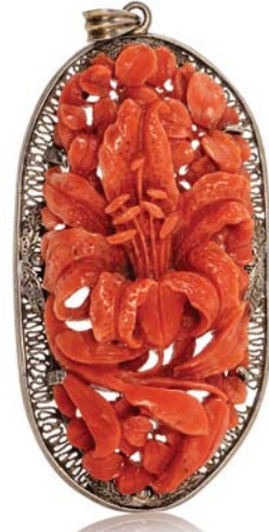
64 CHINE FIN XIX E - DÉBUT XX E SIÈCLE

Pendentif en corail sculpté de lys, sur monture argentée ajourée.