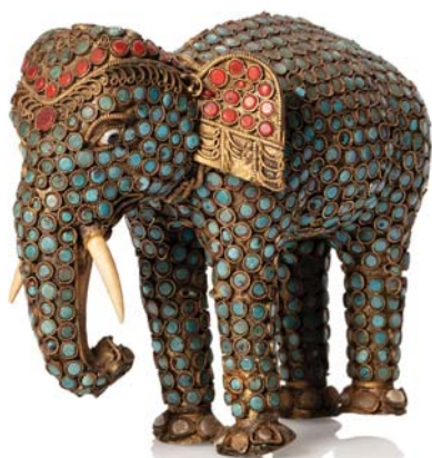
135 TIBET VERS 1900-1920

Eléphant en cuivre avec incrustations de turquoise et cabochons de corail.