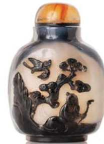
72 CHINE XIX e SIÈCLE

Flacon tabatière en agate gris beige veiné de noir, à décor d'un sage sous un pin de longévité, avec bouchon en agate.