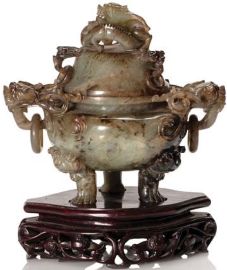
62 CHINE VERS 1920-1940

Brûle-parfum couvert tripode en pierre dure céladon marbrée et mouchetée de brun, de grandes têtes de dragon tenant des anneaux mobiles formant les anses, trois plus petites ornant le couvercle dont la prise représente un dragon en ronde-bosse, les pieds crachés par des masques de Qirin. Avec son socle en bois