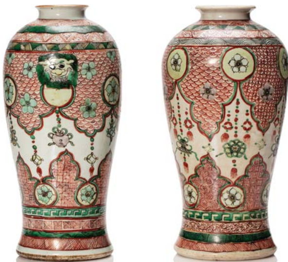
11 CHINE XIX e SIÈCLE

Deux vases formant pendants en porcelaine émaillée corail et vert, à décor de médaillons floraux et masques zoomorphes retenant des panneaux polylobés d'où pendent des motifs auspicioeux.