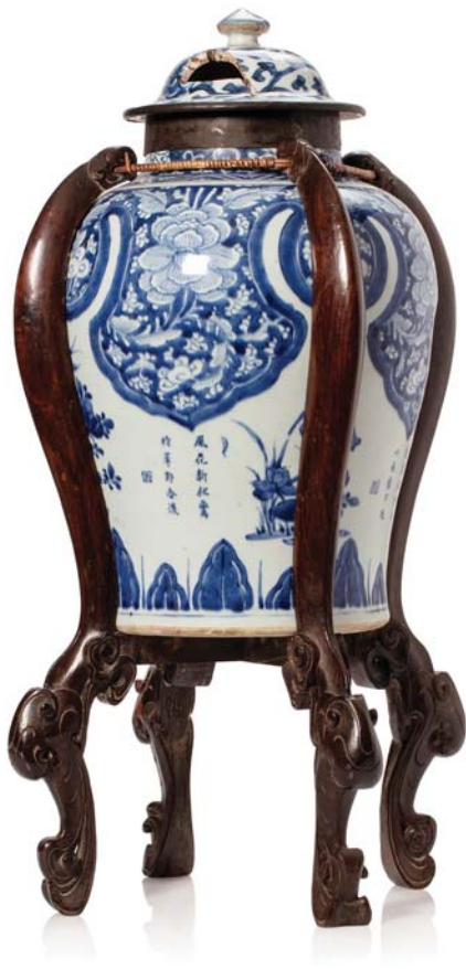
9 CHINE XVIII e SIÈCLE

Potiche en porcelaine bleu-blanc à décor floral, avec louange de chaque fleurs sous forme de poème, dont le lotus, fleurs de poirier, narcisse et rhododendron. Monture en bois sculpté à quatre pieds. (Couvercle cassé et rapporté, col de la potiche restauré 盖子碎裂 罐颈有修).