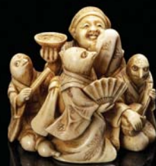
172 JAPON PÉRIODE MEIJI (1868-1912)