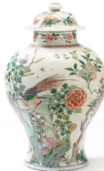
21 CHINE XIX e SIÈCLE

Potiche couverte en porcelaine et émaux de style famille verte, à décor d'un couple de faisans, d'oiseaux et papillons, parmi rochers, pivoiniers en fleurs, et prunus.