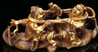
215 JAPON PÉRIODE MEIJI (1868-1912)

Okimono-netsuke en ivoire teinté, représentant deux lutteurs assis face à face sur une sandale getta, reliés par une écharpe passant autour du cou de chacun. Signé dans un cartouche noir.