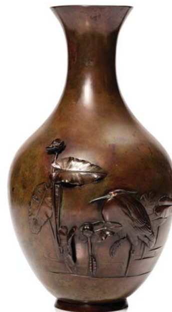
251 JAPON PÉRIODE MEIJI, FIN XIX e SIÈCLE

Vase en bronze de belle patine brun-vert nuancée de rouge, à panse large et long col évasé, orné en haut relief d'un héron parmi des lotus, son œil doré.