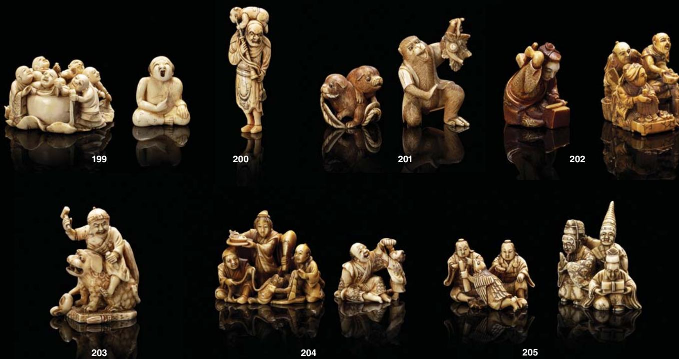
199 JAPON PÉRIODE MEIJI (1868-1912)