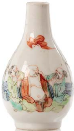
73 CHINE PÉRIODE QING

Flacon tabatière en porcelaine et émaux de la famille rose, à décor de deux dignitaires allongés écoutant l'enseignement du Bouddha. Marque apocryphe Yongzheng.