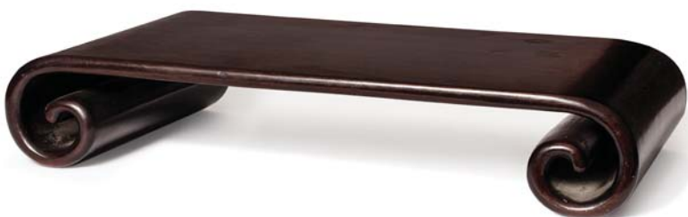
84 CHINE XIX E SIÈCLE

Petite table de lettré en bois à bords enroulés.