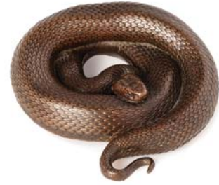
241 JAPON PÉRIODE MEIJI, FIN XIX e SIÈCLE

Okimono en bronze de patine claire, représentant un serpent lové.