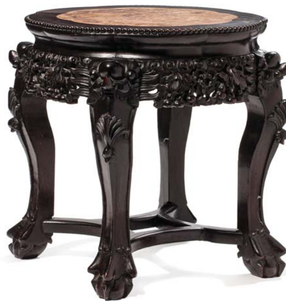
83 CHINE VERS 1900

Tabouret à plateau polylobé avec plaque en marbre rose, la ceinture sculptée de coloquintes et feuillages, les quatre pieds réunis par des entretoises rayonnantes et crachés par des têtes fantastiques.