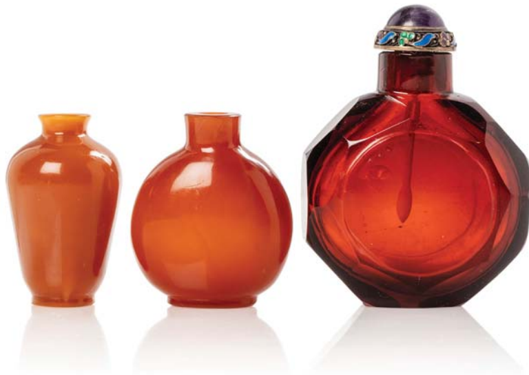
65 CHINE DÉBUT XX E SIÈCLE

Lot comprenant trois flacons tabatières en verre, l'un de forme gourde à bord facetté de couleur ambre, et deux à l'imitation de l'agate.