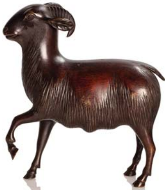
242 JAPON VERS 1900

Okimono en bronze de patine brun-rouge représentant un bélier, la patte avant gauche levée.