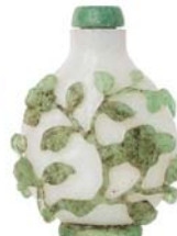
74 CHINE DÉBUT XX e SIÈCLE

Lot de trois flacons tabatières en verre overlay, l'un à décor en rouge représentant une calligraphie sur fond flocon de neige, l'un à décor d'un canard vert sur fond jaune, et un à décor de végétaux sur fond blanc.