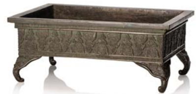
244 JAPON VERS 1900-1920