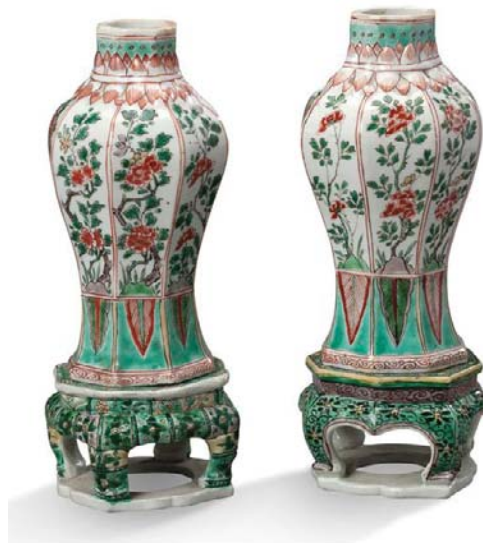
19 CHINE PÉRIODE KANGXI, XVIII e SIÈCLE

Paire de vases balustres à pans coupés en porcelaine et émaux de la famille verte, le décor central composé de huit branchages fleuris, la partie inférieure ornée de feuilles de bananiers stylisés, le col à motifs de feuilles de lotus en léger relief. Le support à l'imitation du bambou émaillé en sancai, à décor de fleurs.