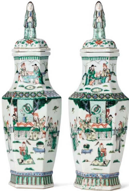
15 CHINE XIX e SIÈCLE

Paire de vases balustres hexagonaux couverts, en porcelaine et émaux de la famille verte, ornés sur un côté d'une scène animée d'un dignitaire et personnages dans un jardin, l'autre côté à décor d'un faisan sur un rocher parmi papillon, fruits et fleurs, le pied et l'épaule soulignés de motifs géométriques.