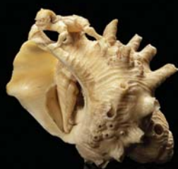
171 JAPON PÉRIODE MEIJI (1868-1912)

Petit okimono en ivoire sculpté en forme de conque sur laquelle est grimpé un oni regardant un petit coquillage à l'intérieur. (Petites égrenures)