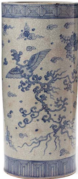
82 JAPON 1 ÈRE MOITIÉ DU XX E SIÈCLE

Grand vase cylindrique de type « porte-parapluie » en porcelaine bleu blanc, à décor de phénix stylisés parmi des nuages et fleurs de paulownia sur fond craquelé beige. (Petites égrenures et fêles 小磨损)