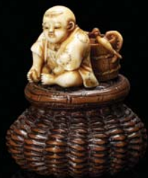
222 JAPON PÉRIODE MEIJI (1868-1912)