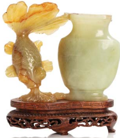
63 CHINE MILIEU XX E SIÈCLE

Groupe en jade formé d'un vase céladon accolé à un poisson-voile céladon veiné de brun. (Manque le couvercle du vase et petites égrenures 缺盖 有轻微磨损)