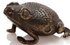
109 CHINE XIX e SIÈCLE

Ensemble de trois poids de calligraphes en bronze de patine claire, représentant des crapauds, dont un niellé.