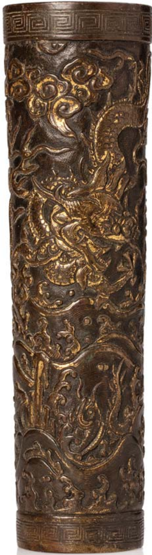
104 CHINE XVII e SIÈCLE

Petit vase de forme cylindrique en bronze finement ciselé et réhaussé d'or à décor de dragons parmi des nuages au dessus de vagues écumantes. Porte la marque Da ming sur la base.