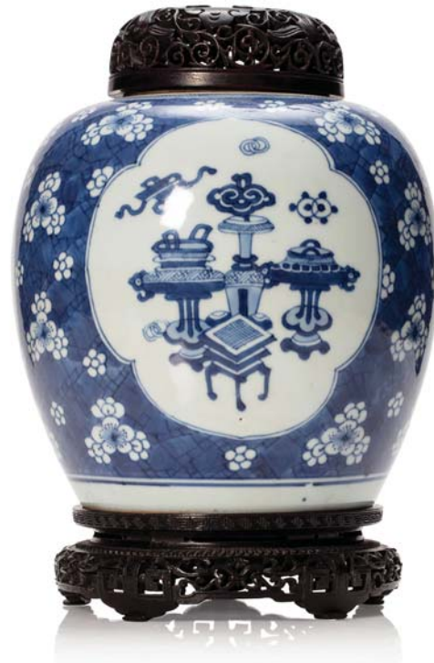
10 CHINE XVIII e SIÈCLE

Pot à gingembre en porcelaine bleu-blanc orné sur la panse de trois médaillons à décor d'objets mobiliers et motifs auspicioeux.