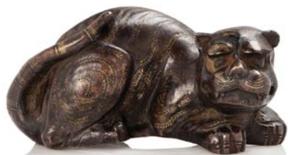
252 JAPON XIX e SIÈCLE

Okimono en bronze de patine brune figurant un tigre couché, les poils niellés or.