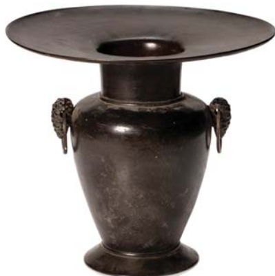
250 JAPON PÉRIODE MEIJI, FIN XIX e SIÈCLE

Vase usubata en bronze de patine brune, à panse se rétrécissant vers un pied évasé, et large ouverture plate, l'épaule rehaussée de deux anses en forme de pomme de pin tenant des anneaux.