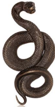
240 JAPON XIX e SIÈCLE

Okimono en bronze à patine foncée, représentant un serpent à l'affût.