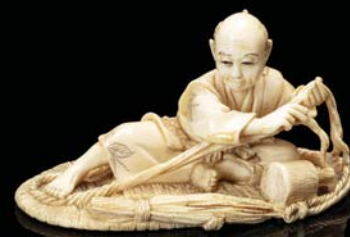
216 JAPON PÉRIODE MEIJI (1868-1912)