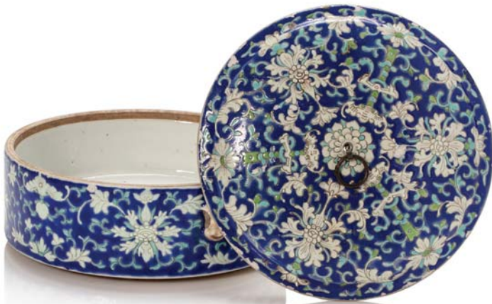
89 CHINE DÉBUT XX e SIÈCLE Boîte couverte circulaire en porcelaine à décor de rinceaux de lotus blancs et verts sur fond bleu, avec petits passants pour des anses en métal. Marque sigillaire Guangxu sur la base. (Petites lacunes d'émail, petit éclat sur la base 伤彩 小磨损)

H. 6,5 cm - Diam. 17 cm 中国二十世纪初 光绪款 粉彩缠枝莲纹圆瓷盒