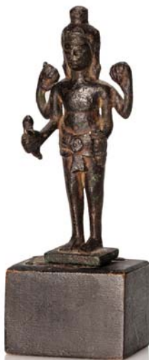
145 ASIE DU SUD-EST XII E -XIII E SIÈCLE

Deux petits sujets en bronze, l'un représentant Avalokiteshvara (Java, XIIe-XIIIe siècle) ; l'autre une divinité debout, (Art khmer du Bayon, XIIe siècle).