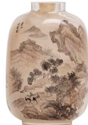
75 CHINE XX e SIÈCLE

Flacon tabatière en verre peint à l'intérieur, à décor d'un sage avec son disciple dans un paysage montagneux.