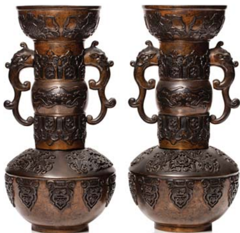
249 JAPON VERS 1900-1920

Paire de grands vases en bronze bicolore à panse basse et haut col divisé en registre et surmonté d'une ouverture en forme de coupe, l'ensemble à décor de motifs archaisants et stylisés de patine brune sur fond patiné ocre, avec deux grandes anses crachées par des têtes zoomorphes.