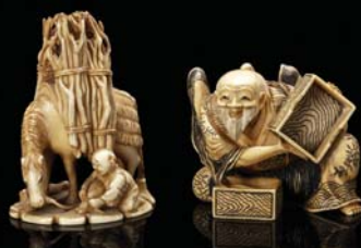
214 JAPON PÉRIODE MEIJI (1868-1912)