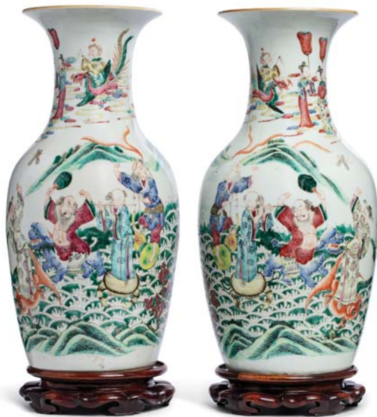
18 CHINE XIX e SIÈCLE

Paire de vases en porcelaine à décor des huit immortels traversant le fleuve. (Fêle sur le col d'un des vases, usures des émaux 瓶颈有裂)