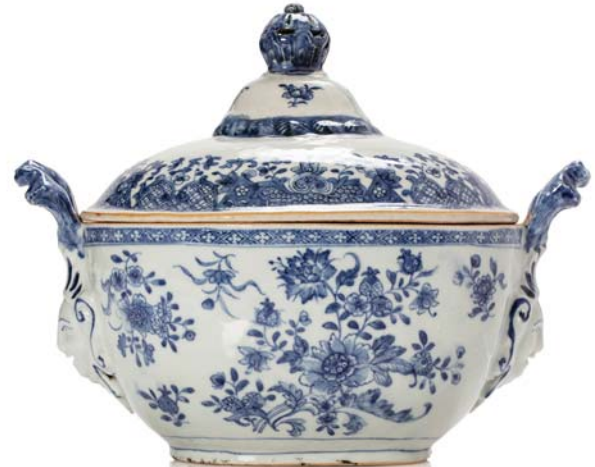
88 CHINE DYNASTIE DES QING Terrine couverte en porcelaine émaillée bleu et blanc à décor de fleurs. H. 22 x 29 cm 清朝 青花折枝花卉带盖汤皿