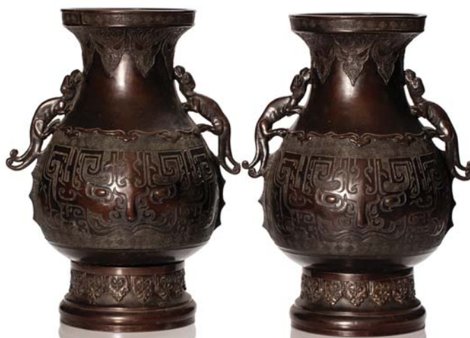
253 JAPON DÉBUT XX e SIÈCLE

Paire de vases en bronze de patine brune, reprenant la forme des Hu chinois, la panse à décor archaisant de masques de taotie, les anses figurant des dragons.