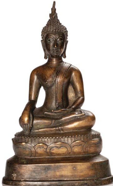
143 THAILANDE-LAOS XIX E SIÈCLE

Sujet en bronze représentant le Bouddha assis en méditation sur un socle lotiforme.