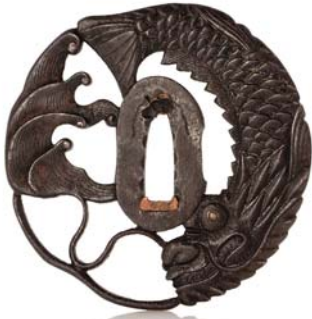
239 JAPON XVIII e SIÈCLE

Sukashi tsuba en fer, représentant un poisson-dragon parmi des vagues stylisées.