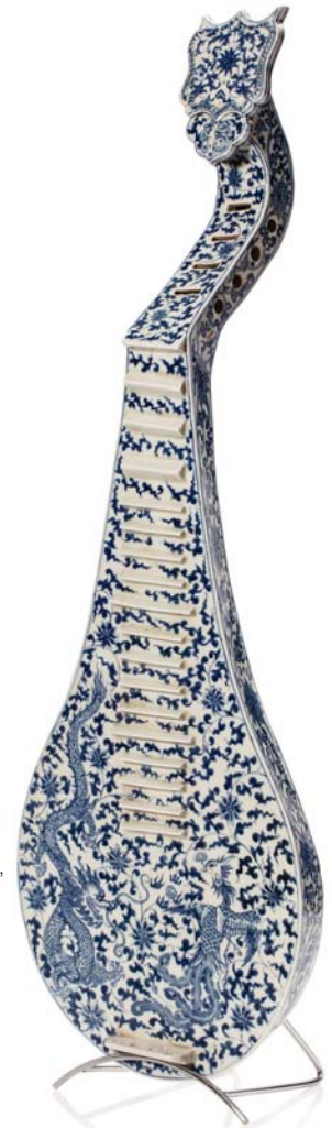
90 CHINE XX e SIÈCLE Modèle de Pipa, instrument de musique à cordes, en porcelaine bleu-blanc, à décor de dragon et phénix, parmi des rinceaux de fleurs et feuillages de lotus.