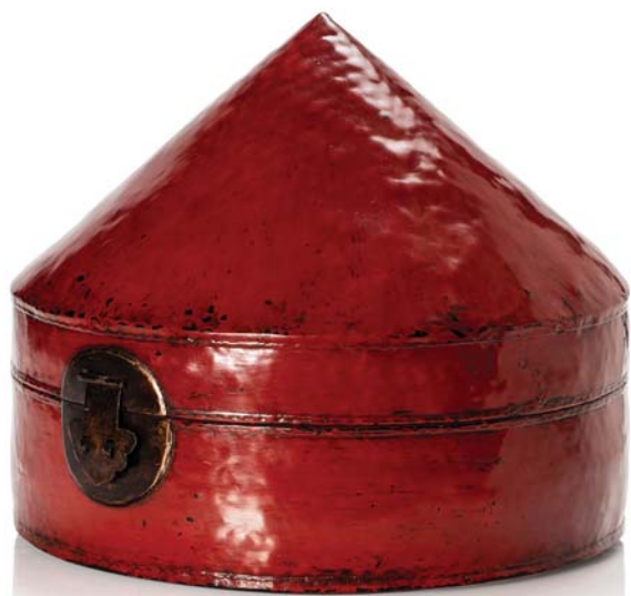
138 TIBET FIN XIX e SIÈCLE