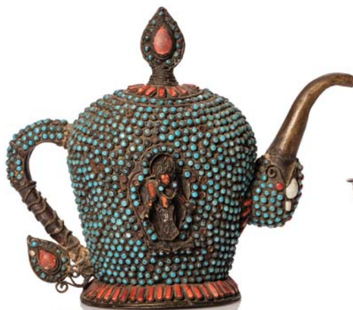
136 TIBET VERS 1900-1920

Verseuse en cuivre en forme de base de stupa, entièrement incrustée de petits cabochons de turquoise et rehaussé de corail, la panse ornée de divinités, la prise du couvercle surmonté d'un bouton de lotus. (Restauration, petits manques)