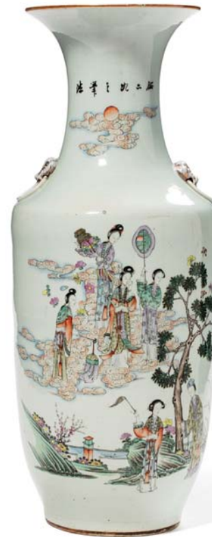
16 CHINE VERS 1900

Vase baluste en porcelaine et émaux de la famille rose, à décor de divinités féminines dans les nuages, observant en contrebas un couple auprès d'un pin ; un poème calligraphié de l'autre côté du vase ; l'épaule rehaussée de deux masques de chimère en relief. (Petites égrenures autour de l'ouverture)