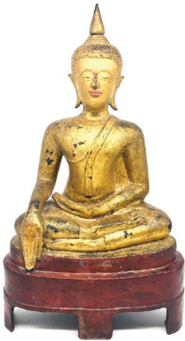
142 SIAM VERS 1900

Siam, vers 1900, Statuette en bronze représentant un bouddha assis en méditation, faisant le geste de la prise de la terre à témoin.