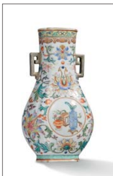
CHINE XX E SIÈCLE ADJUGÉ 70 200 € TTC