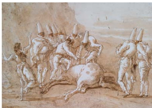
GIOVANNI DOMENICO TIEPOLO (1727 - 1804) ADJUGÉ 331 500 € TTC