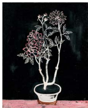
SANYU (1901-1966) ADJUGÉ 8 797 500 € TTC

Pour inclure vos objets d'art, tableaux, automobiles de collection ou encore bijoux dans nos prochaines ventes, contactez-nous : expertise@agutttes.com Paris : 01 47 45 55 55 | Lyon : 04 37 24 24 24