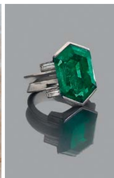
BAGUE EN PLATINE SERTIE D'UNE IMPORTANTE ÉMERAUDE ADJUGÉ 765 000 € TTC