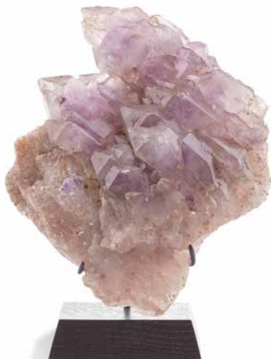
62 Améthyste cathédrale. Madagascar

Pièce en rapport : voir Sotheby's Hong Kong, Lot 2801, 5 Avril 2015- Sotheby's Paris, lot 95, 18 Février 2016.