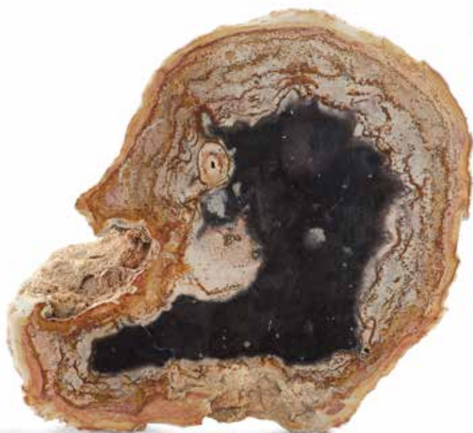
74 Tranche de palmier fossile montrant un profil humain. Pliocène, Sumatra, Indonésie