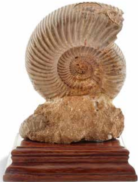
20 Ammonite Phyloceras veledé. Albien, Majunga, Madagascar

Ammonite polie montrant de belles lignes de sutures blanches sur un fond de calcite brune.