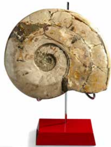
25 Grande ammonite Cleoniceras nacré. Albién, Majunga, Madagascar

L'ammonite présente une belle coquille de couleur crème.