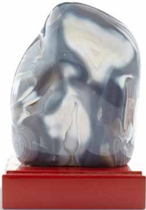
72 Agate bleue gris et laiteuse