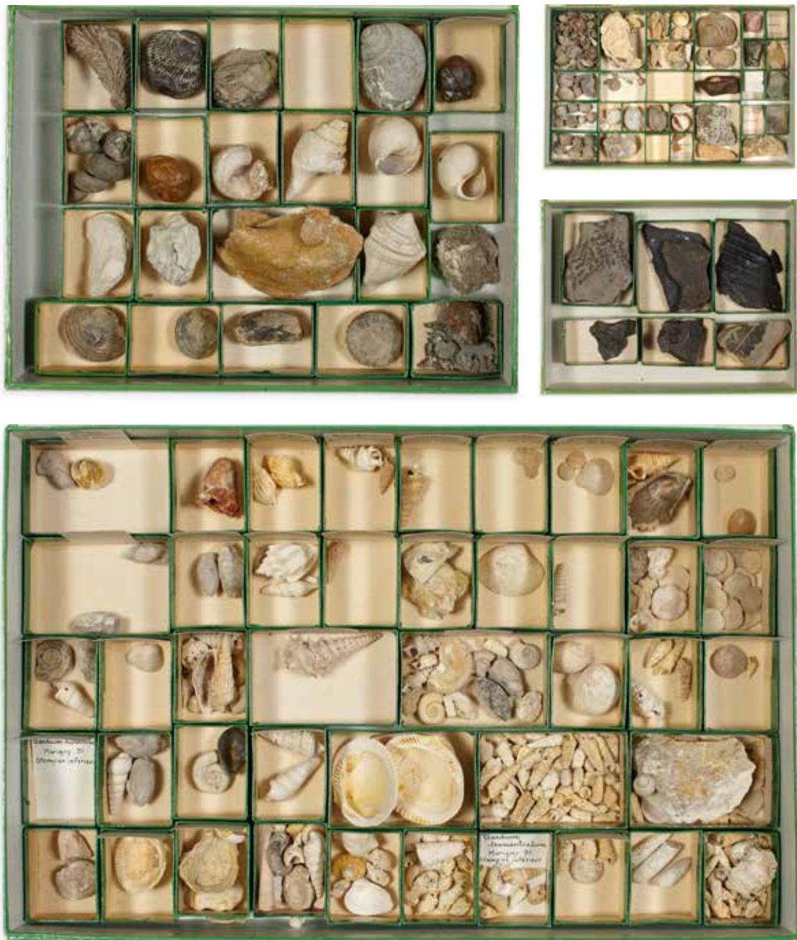
46 Collection de quatre coffrets de fossiles divers 150 / 200 €