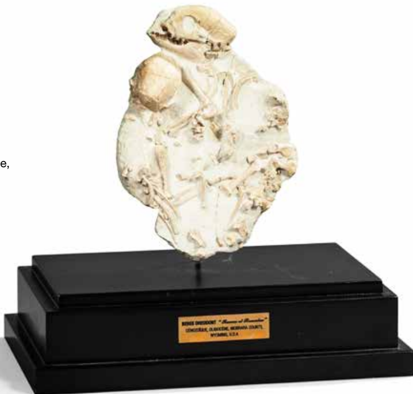
56 Groupe de deux Oréodons dans leur gange, Oligocène. Sud Dakota, USA Beau spécimen. Hauteur : 21 cm - Largeur : 15 cm 2 000 / 3 000 €