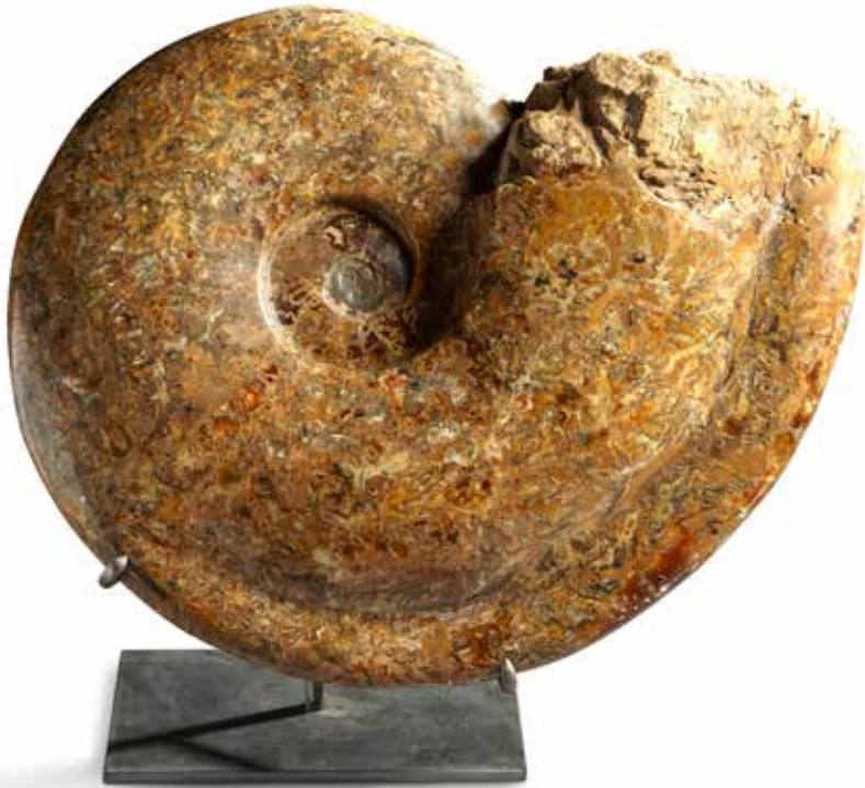
50 Très remarquable ammonite Pachydiscus géante, Crétacé, Madagascar Entièrement minéralisée en calcite et présentée sur un socle. Diamètre : 82 cm 2 500 / 3 500 €