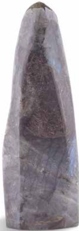
69 Labradorite en forme d'obélisque. Belle qualité de bleu outremer. Dimensions : 23 x 7,5 cm 200 / 300 €