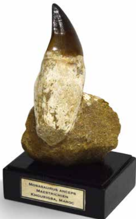
40 Dent de Mosasaurus anceps- Maastrichtien, Crétacé - Khouribga, Maroc.

Présentée sur gangue. Conservation parfaite, le Mosasaure était un grand prédateur marin contemporain des derniers dinosaures. Découvert à Maastricht à la montagne Saint Pierre au XVIII e siècle, c'est Cuvier qui en 1808 y reconnut un grand reptile aquatique proche des varans.