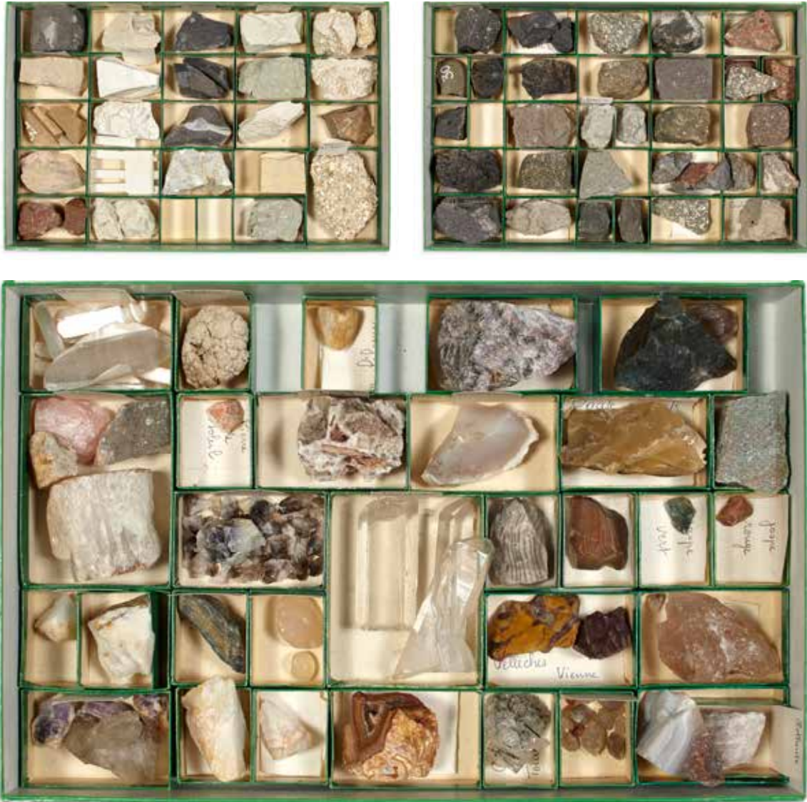
46B Collection de trois coffrets de minéraux. (Agates, quartz...)