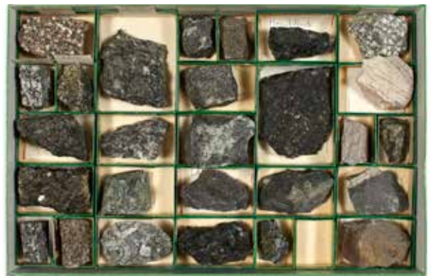
44 Collection de trois coffrets de minéraux et roches volcaniques