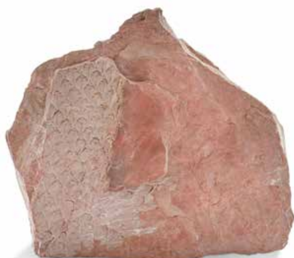
43 Ecorce de fougère fossile Lepidodendron. Ere Primaire

Le Lepidodendron était une fougère arborescente fossile. Sur le tronc fossile, on voit très bien les cicatrices des insertions foliaires dessinant des sortes d'écusson.