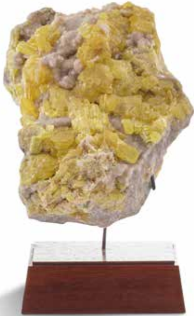
75 Soufre cristallisé. Sicile, Italie Dimensions : 16 x 12 cm 100 / 200 €