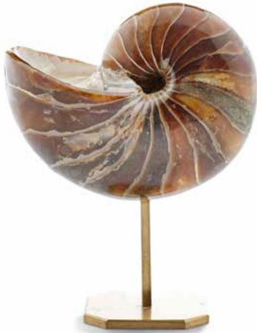
21 Beau nautilé présenté sur un socle en laiton. Albien, Majunga, Madagascar Diamètre : 13 cm 400 / 600 €