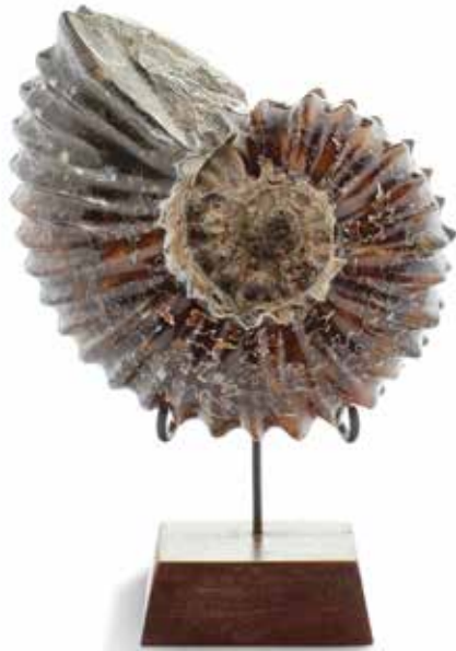
18 Ammonite Perisphinctes, Oxfordien, Jurassique, Zakara, Madagascar

Les ammonites au sens large (Ammonoidea) forment une sous-classe éteinte des mollusques céphalopodes. Elles apparaissent dans le registre fossile durant le Dévonien et disparaissent peu après la crise Crétacé-Paléocène. Elles se caractérisaient par une coquille univalve plus ou moins enroulée dont seule la dernière loge était occupée par l'animal, les autres loges servent à contrôler sa flottaison. Leurs fossiles sont considérés comme d'excellents marqueurs chronologiques. Leur taille va de quelques millimètres à plus de 2 mètres de diamètre. Diamètre : 12 cm