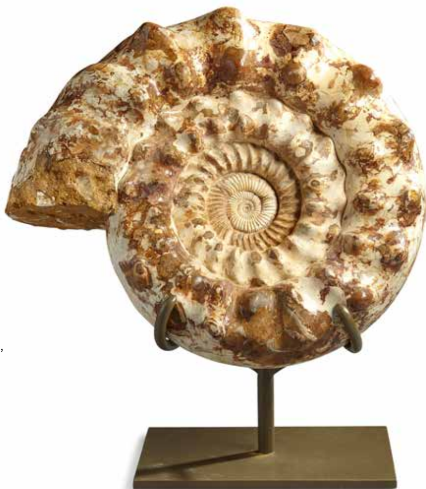
52 Grande ammonite Cranosphinctes, Mésozoïque, Oxfordien, Jurassique supérieur 161-145 MILLIONS D'ANNÉES), Zakara, Madagascar Diamètre : 55 cm 3 000 / 4 000 €