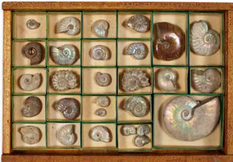
26 Coffret contenant une collection de 25 ammonites. Albién, et divers