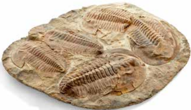
33 Une plaque de trilobite Andalousiana présentant 5 spécimens. Cambrien moyen, Maroc Dimensions de la gangue : 44 x 39 cm 300 / 400 €