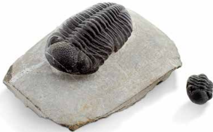
30 Trilobite Phacops , Dévonien, Erfoud, Maroc, avec un juvénile Dimension : 8 cm, sur gangue (12 x 8 cm) Dimension du spécimen juvénile : 22 mm 150 / 200 €