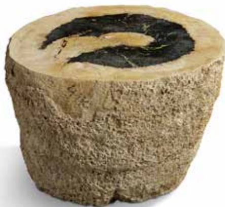
59 Tronc formant un tabouret. Bois fossile de palmier. Pliocène, Sumatra, Indonésie Dimensions : 35 x 32 x 23 cm 300 / 400 €