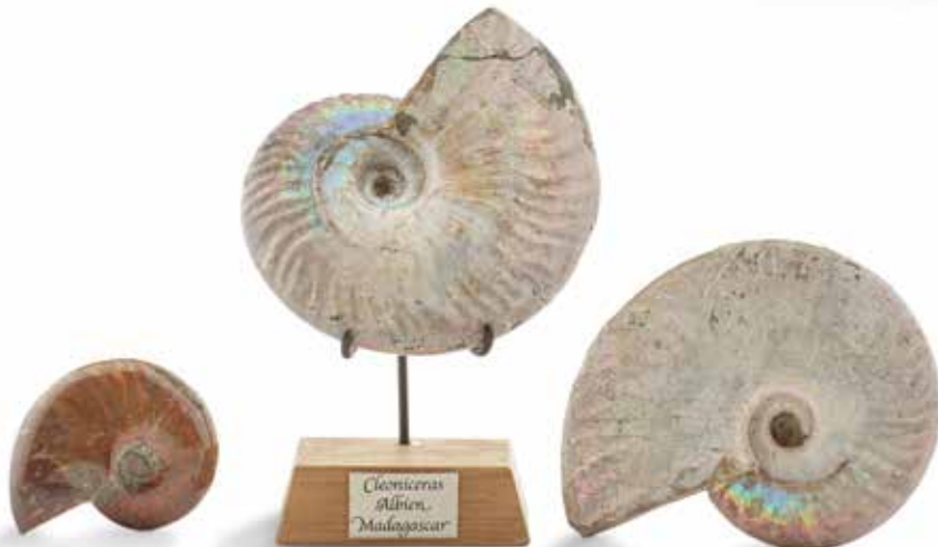
23 Collection de trois Ammonite Cleoniceras nacrées. Albien, Majunga, Madagascar. Diamètre : de 7 à 10 cm 120 / 150 €