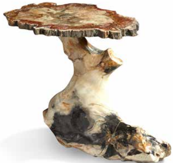
60 Table en bois fossile formant un « bout de canapé » Hauteur : 45 cm Dimensions du plateau : 45 x 34 cm 600 / 800 €