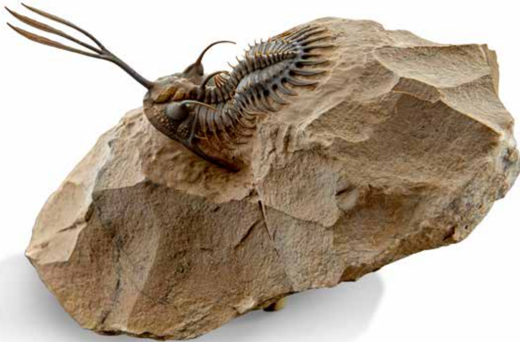
32 Très belle Trilobite Wallicerops trifurcatus . Emsien sup. Fom zguid, Maroc Dimension : 6,9 cm 3 000 / 4 000 €