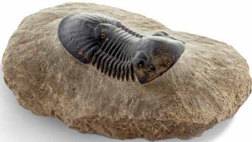
29 Trilobite Paralejurus dormitzeri , Dévonien moyen, Alnif, Maroc Dimension : 7,2 cm 200 / 250 €