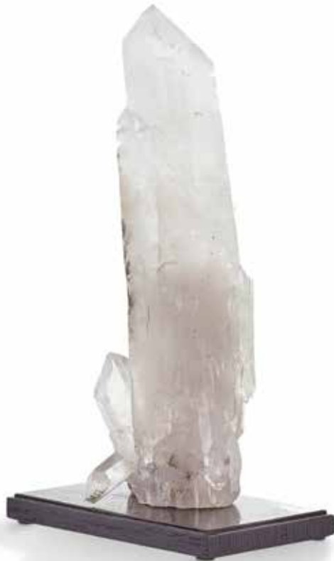
63 Grand cristal de Quartz. Brésil Hauteur : 25 cm 200 / 250 €