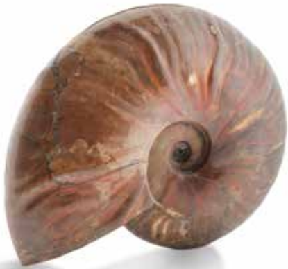
24 Belle ammonite Cleoniceras de couleur rouge opale. Albién, Majunga, Madagascar