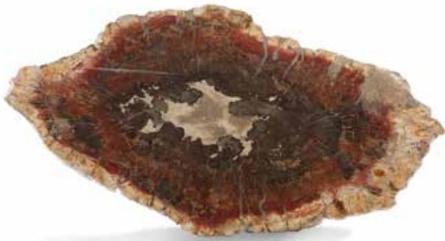
57 Tranche de bois fossile Forme ovale. Dimensions : 46 cm x 24 cm 200 / 250 €