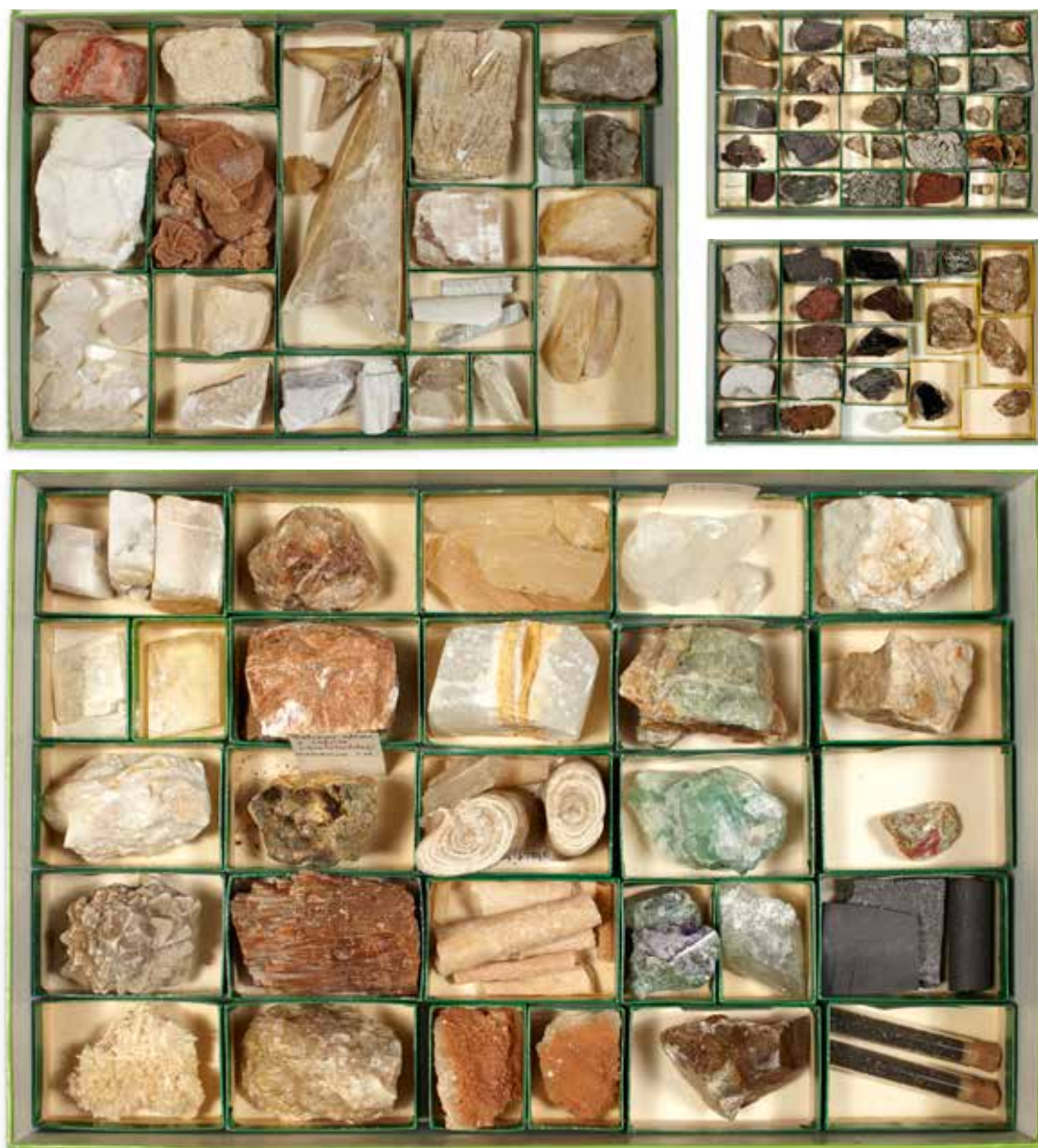
46C Collection de quatre coffrets de minéraux et fossiles divers 150 / 200 €