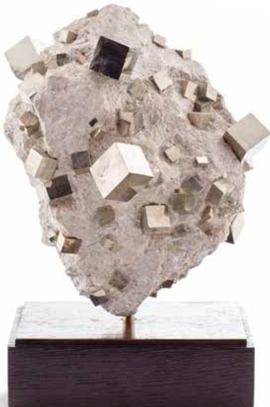
71 Pyrite, Navajun, Espagne. (130.000.000 d'années) La pyrite cubique ou hexaèdre de la mine Navajun en Espagne est unique au monde. Cette mine découverte en 1960 est la seule qui offre ces cristaux cubiques. Spécimen présentant plusieurs cristaux cubiques sur la gangue. Dimensions : 16 x 13 cm 300 / 400 €