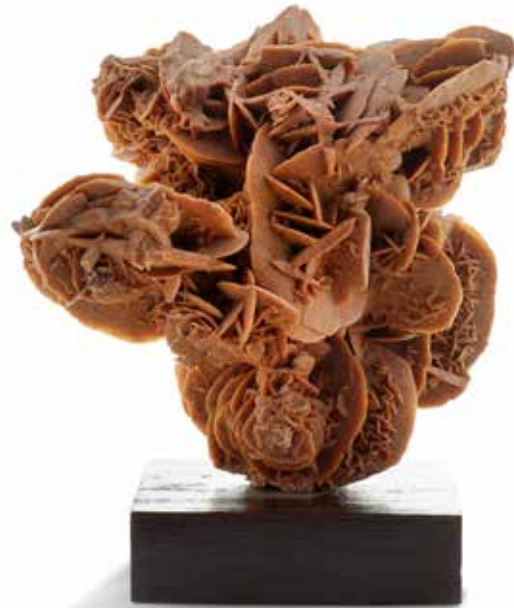
76 Rose des sables, gypse, Sahara Dimensions : 18 x 18 cm 50 / 70 €