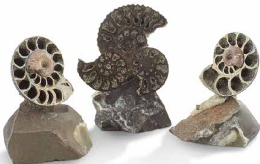
53 Collection de trois jolis blocs d'ammonites Queenstedtoceras- Jurassique, Russie Belle minéralisation en pyrite. Dimensions : 8 à 9 cm 100 / 150 €