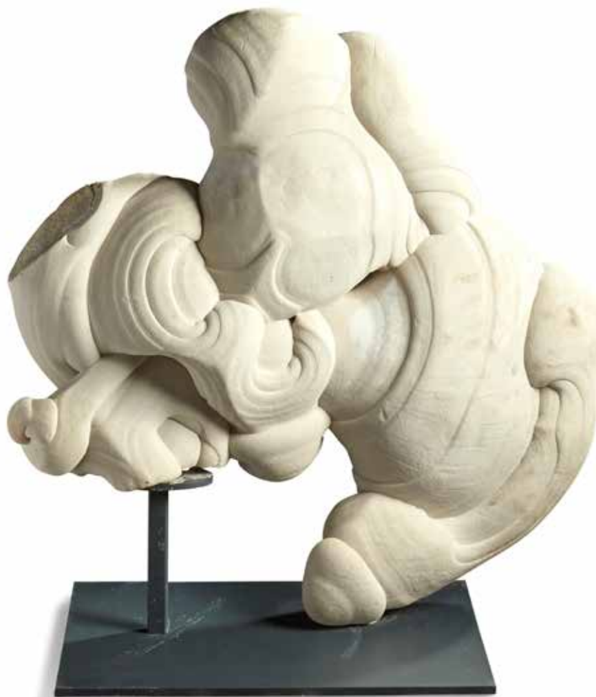
61 Gogotte. Oligocène, Fontainebleau, France Curiosité minérale constituée de matériaux gréseux épousant un relief aléatoire d'excroissances. Ces curiosités minérales ont, entre autres, servi à la décoration de l'une des fontaines préférées de Louis XIV, au château de Versailles. Hauteur : 80 cm