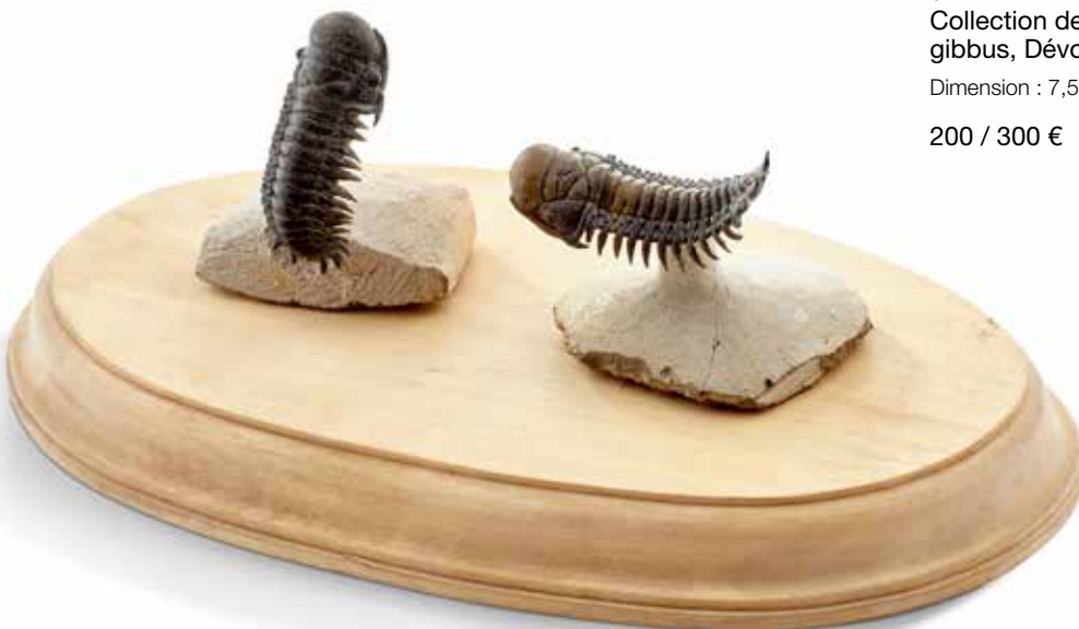
31 Collection de deux trilobites Crotalocephalina gibbus , Dévonien, Lamrakeb, Alnif, Maroc Dimension : 7,5 cm 200 / 300 €