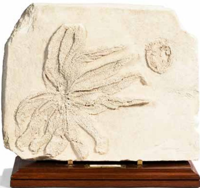
55 Etoile de mer Acanthaster , cénozoïque, Miocène, 23,5 millions d'années. Lacoste, Vaucluse Forme ovale. Dimensions : 31,5 x 40 cm 2 500 / 3 000 €