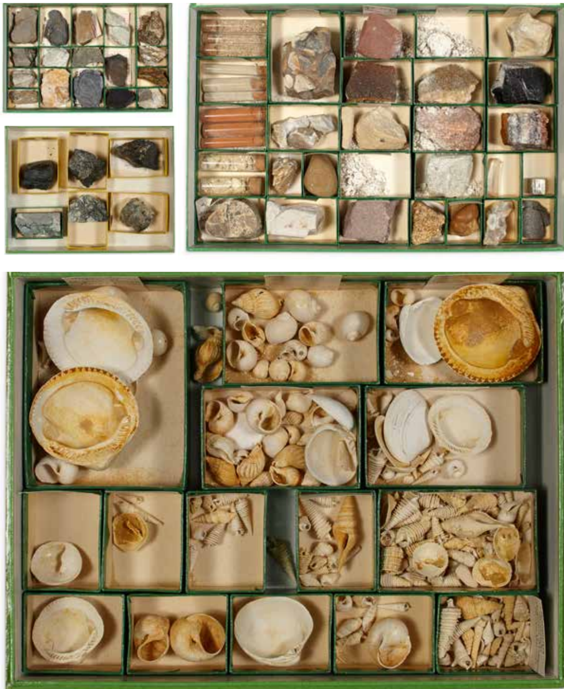
46D Collection de quatre coffrets de minéraux et fossiles divers