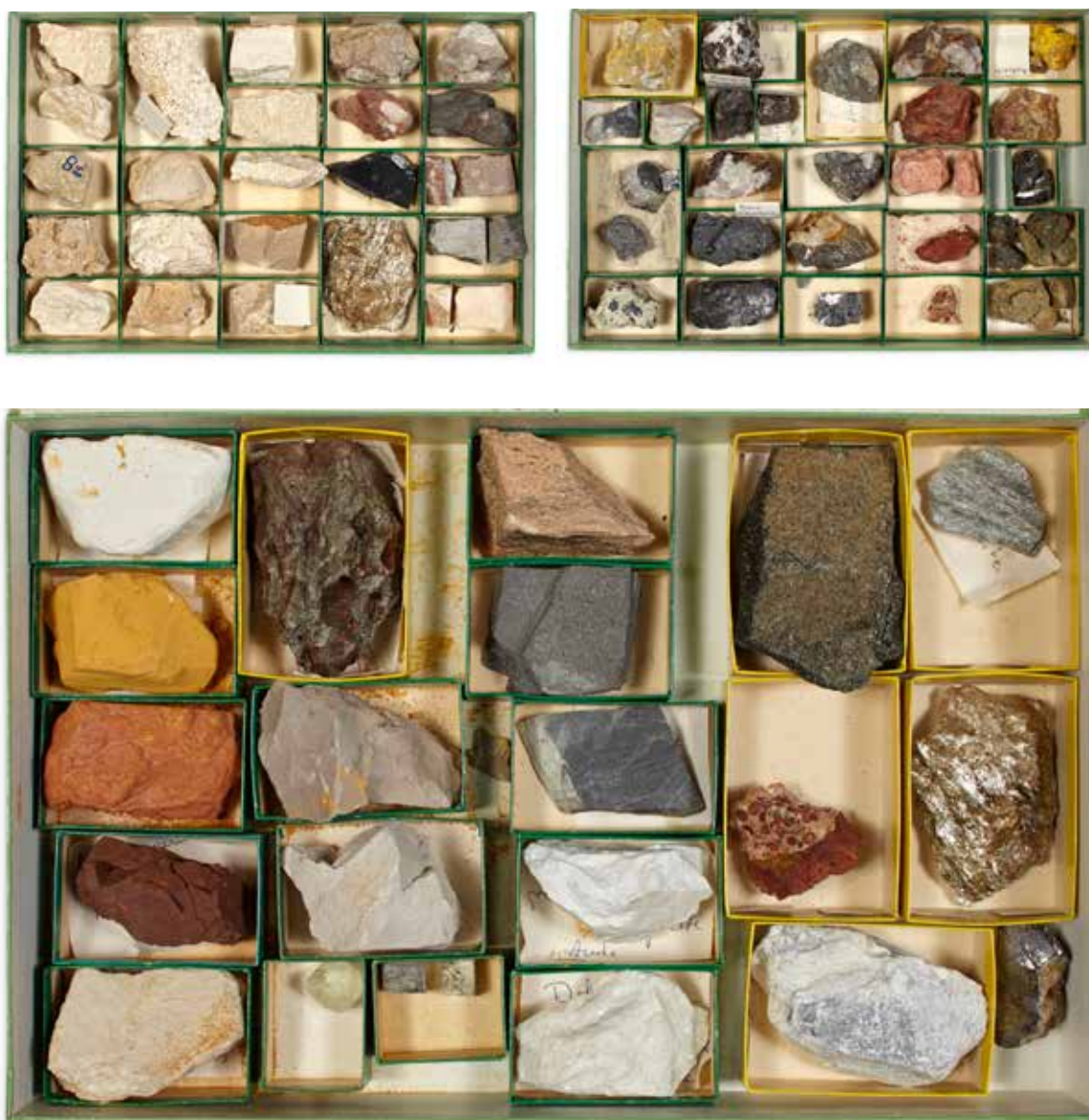
45 Collection de trois coffrets de minéraux 150 / 200 €