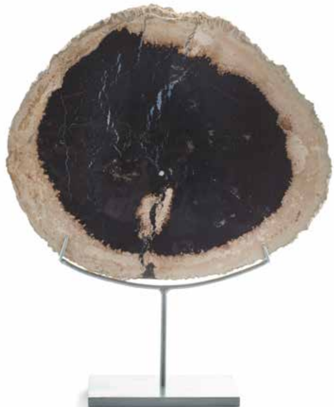
51 Tranche de bois fossile. Palmier. Pliocène, Sumatra, Indonésie Présentée sur un socle. Dimensions : 32 cm x 29 cm Hauteur (avec le socle) : 40 cm 200 / 300 €