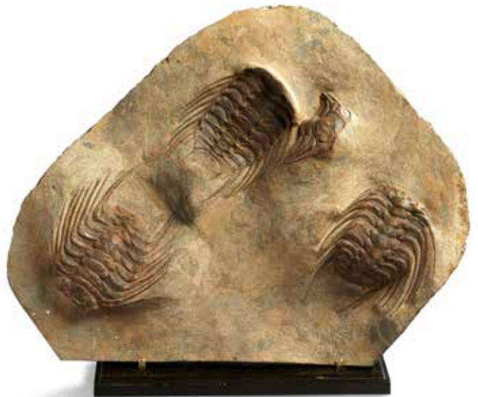
34 Une belle plaque de quatre trilobites Selenopeltis buchii . Ordovician (450 millions d'années), Sud Maroc Dimensions de la gangue : 45 x 34 cm 600 / 800 €