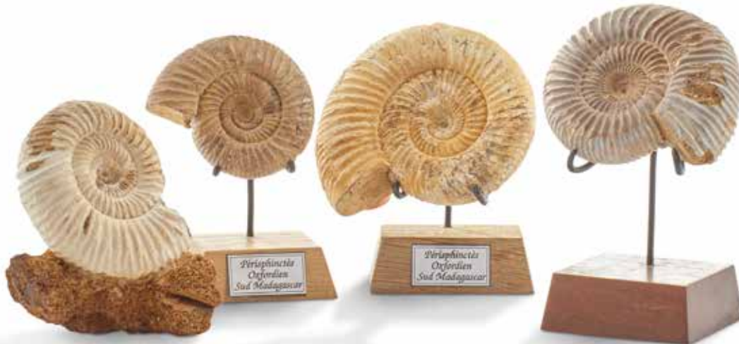
22 Collection de quatre ammonites Perisphinctes. Oxfordien, Jurassique, Zakara, Madagascar Diamètre : de 5 à 6 cm 80 / 100 €