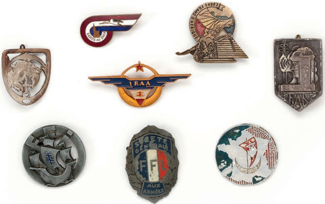
120 Lot d'insignes de l'Armée de Libération, FFL, commandos... (8 pièces env.) 80 / 100 €