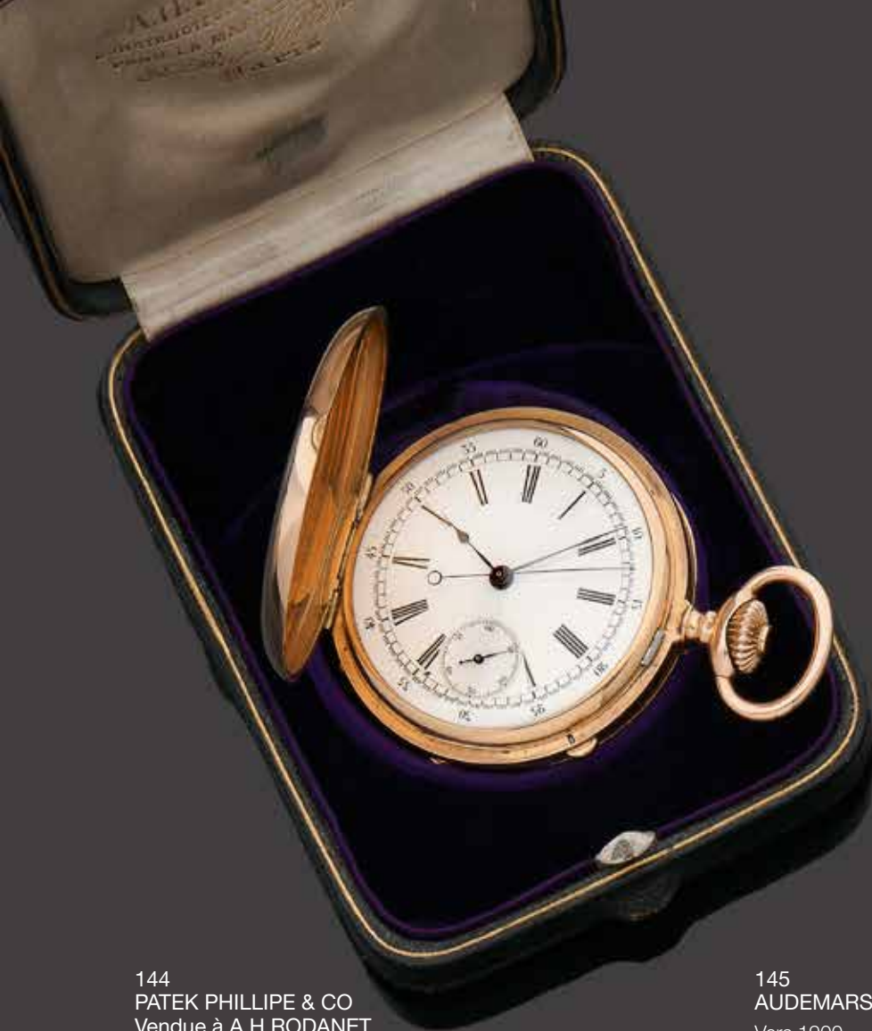
144 PATEK PHILLIPE & CO Vendue à A.H RODANET

Vers 1900 Montre de gousset chronographe savonnette en or. Cadran émail, chiffres romains, aiguilles poire. Mouvement 16 lignes, échappement à ancre, balancier bimétallique. Spiral Breguet. Freq 18000 alt/h. Remontoir au pendant. Boitier 4 corps. Ecrin d'origine signé RODANET. Fonctionne, bon état. Monogramme au dos. Poids total brut : 110,8 gr. Diam : 50 mm