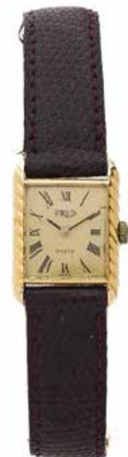
131 GERALD GENTA POUR FRED No. G1057 / 294 Vers 1970

Montre bracelet de dame en or jaune 18k (750) Boîtier : rectangulaire, couronne de remontoir ornée d'un cabochon, fond clippé, numéroté Cadran : doré, chiffres romains, signé Fred Paris Mouvement : mécanique signé Gerald Genta Boucle : déployante en or Dim. 26 x 19 mm Poids brut : 29, 15 g