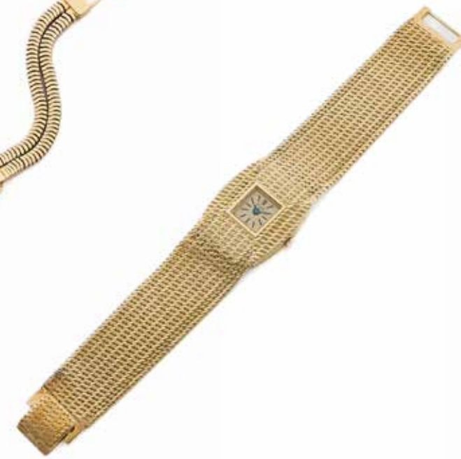
79 PIAGET Réf. 9149, No. 80800 Vers 1962

Montre bracelet de dame en or jaune 18k (750) Boîtier : coussin, fermeture à vis, signé Cadran : crème, index « bâton », signé Mouvement : mécanique, signé Bracelet : ruban en or, fermoir signé Tour de poignet : approx. 15 cm Dim. 23 x 22 mm Poids brut : 55,00 g Uniquement 4 pièces furent produites entre 1961 et 1962