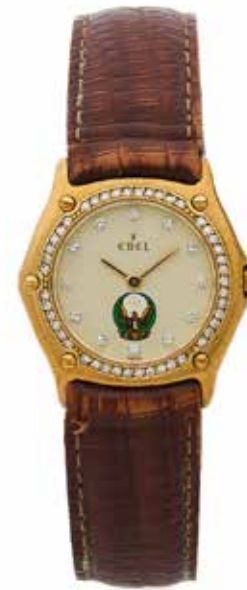
139 EBEL Vers 1980

Montre de présent en or jaune 18k (750) et diamants Boîtier : stylisé avec lunette index diamants, signé (manque au dos) Cadran : crème avec impression polychrome du drapeau des Émirats Arabes Unis, signé Mouvement : quartz Diam. 27 mm Poids brut. 29,90 g