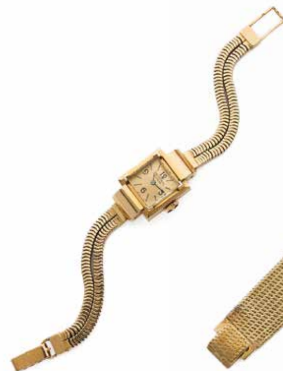
78 UNIVERSAL GENÈVE « Boîte française », No. 26708 Vers 1940

Montre bracelet de dame en or jaune 18k (750) Boîtier : carré, fond clippé, numéroté Cadran : doré, chiffres arabes, index « bâton », signé Mouvement : mécanique cal. 219, signé Bracelet : « serpent » en or Tour de poignet : approx. 15 cm Dim. 27 x 17 mm Poids brut : 36,00 g