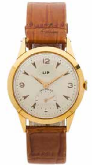
141 LIP No. 971652 Vers 1960

Montre bracelet en acier et métal doré Boîtier : rond, signé Cadran : argenté, chiffres arabes, index appliqués, trotteuse excentrée, signé Mouvement : mécanique incabloc Diam. 34 mm