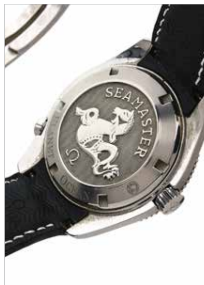
128 OMEGA Seamaster, No. 85285583 Vers 2011

Montre bracelet de plongée en acier Boîtier : rond, couronne et fond vissés, lunette tournante graduée pour les temps de plongée, au dos le logo Seamaster « Planet Ocean », signé Cadran : noir avec index appliqués et aiguilles lumineuses, trotteuse centrale et minuterie chemin de fer, date à guichet, signé Mouvement : automatique avec masse oscillante, échappement co-axial, certifié chronomètre, signé Bracelet / fermoir : en caoutchouc noir avec fermoir déployant en acier signé