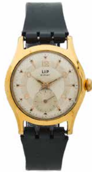
136 LIP Elgiloy, No. 902078 Vers 1960

Montre bracelet acier et métal doré Boîtier : rond, fond vissé, signé Cadran : argenté, chiffres arabes et index appliqués, trotteuse excentrée, signé Mouvement : mécanique Diam. 33 mm