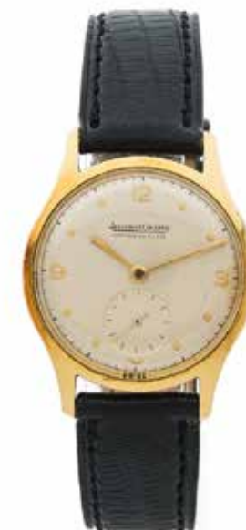
132 JAEGER LECOULTRE No. 102062 / 13645 Vers 1960

Montre bracelet en or jaune 18k (750) Boîtier : rond, fond clippé, poinçon de maître Edmond Jaeger, numéroté Cadran : crème, chiffres arabes et index appliqués, minuterie chemin de fer, trotteuse excentrée, signé Mouvement : mécanique cal. P480/0, signé