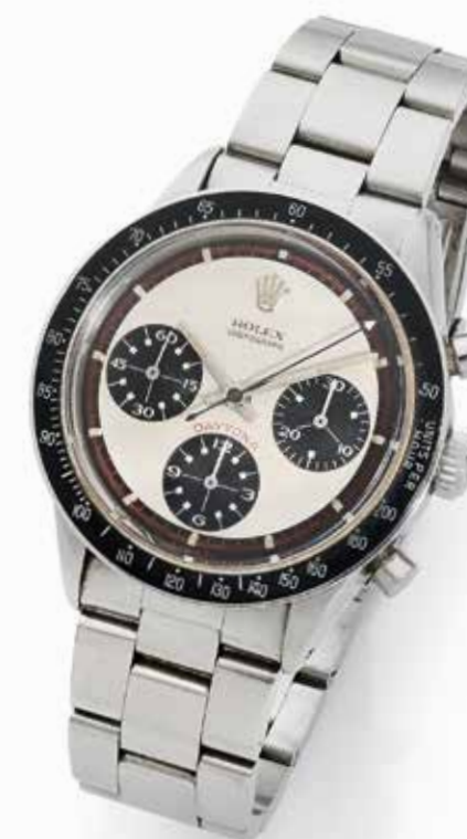
Rolex Daytona Dite « Paul Newman » Réf. 6241, No. 1764891 Vers 1968 Vendue 271 500€