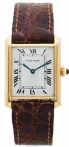
20 CARTIER Tank, 7808612799 Vers 1990

Montre bracelet en or jaune 18k (750) Boîtier : rectangulaire, couronne ornée d'un cabochon, fermeture à vis, signé Cadran : blanc, chiffres romains, minuterie chemin de fer, signé « Paris France » Mouvement : mécanique Boucle : déployante en or 18k, signée