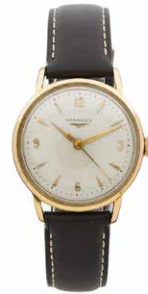
140 LONGINES No. 10031830

Vers 1950 Montre bracelet en acier et métal doré Boîtier : rond, fond vissé Cadran : argenté, chiffres arabes et index appliqués, trotteuse centrale, signé Mouvement : mécanique cal. 23ZS, signé Boucle : ardillon en métal doré, siglée Diam. 33 mm