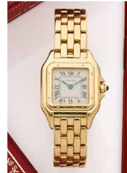
24 CARTIER Panthère PM, réf. 107000M, No. 005370 Vers 1992

Montre bracelet de dame en or jaune 18k (750) Boîtier : coussin, couronne de remontoir ornée d'un cabochon, signé Cadran : crème, chiffres romains, minuterie chemin de fer, signé Mouvement : quartz Bracelet : en or avec boucle déployante signée