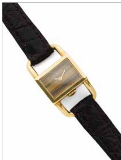
22 JAEGER LE COULTRE Revendue par HERMÈS Réf. 6033.21, No. 1434175 Vers 1960

Montre bracelet de dame en or jaune 18k (750) Boîtier : rectangulaire à attaches, fond clippé, couronne de remontoir à 6h, numéroté avec poinçon de maître EJ et signé Hermès Paris Cadran : œil de tigre sans index, signé Mouvement : mécanique, signé