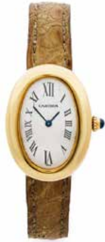
19 CARTIER Baignoire, réf. 1954, No. CC231945 Vers 1990

Montre bracelet de dame en or jaune 18k (750) Boîtier : ovale, couronne de remontoir ornée d'un cabochon, fermeture à vis, signé Cadran : crème, chiffres romains, signé Mouvement : quartz Boucle : ardillon en or, signée