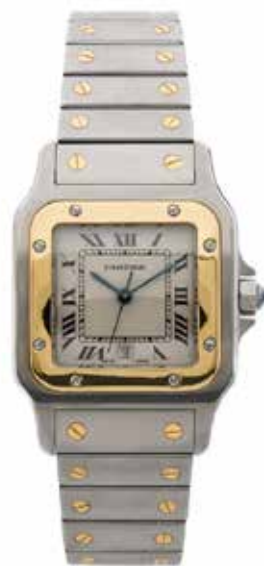
75 CARTIER Santos Galbée, réf. 187901, No. 13050 Vers 1992

Montre bracelet en acier et or jaune 18k (750) Boîtier : coussin, lunette en or à vis, couronne de remontoir ornée d'un saphir facetté, fermeture vis, signé Cadran : crème, chiffres romains, minuterie chemin de fer, trotteuse centrale, date à guichet, signé Mouvement : quartz Bracelet : en acier et or Boucle : déployante signée Diam. 29 x 40 mm Poids brut : 87,50 g Avec : un certificat de garantie du 12.1992, une garantie de service de 2005, écran et surboîte, un livret Montres Santos