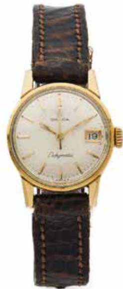
137 OMEGA Ladymatic, ref. 566.011, No. 21188361 Vers 1964

Le modèle Elgiloy tient son nom de la marque américaine Elgin qui développa des ressorts de montres incassables et breveta cette invention. Les montres Lip Elgiloy sont équipées de ces fameux ressorts ultra résistants.