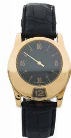
80 GIANNI BULGARI Enigma No. 111262G et 0.041

Nous remercions la Maison Piaget pour son aimable collaboration.