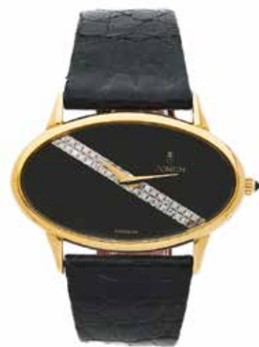
76 CORUM No. 27102 / 166992 Vers 1970

Montre bracelet de dame en or jaune 18k (750) Boîtier : ovale, fond clippé, signé Cadran : onyx, pavé de 2 lignes de brillants, signé Mouvement : mécanique, signé Boucle : ardillon en métal doré, siglée Dim. 40 x 24 mm Poids brut : 36,50 g