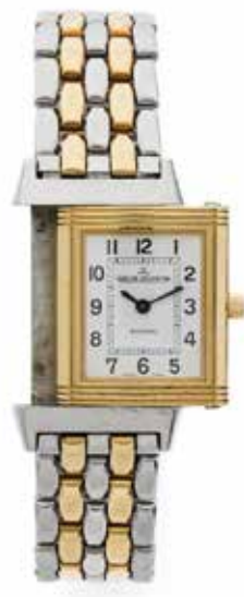
74 JAEGER LECOULTRE Reverso, réf. 260.5.86, No. 2596342 Vers 1990

Montre bracelet de dame en acier en or jaune 18k (750) Boîtier : rectangulaire, réversible, signé Cadran : opalin, chiffres arabes, minuterie chemin de fer, signé Mouvement : mécanique signé Bracelet : en or et acier Boucle : déployante acier signée Tour de poignet : approx. 17 cm Dim. 20 x 33 mm