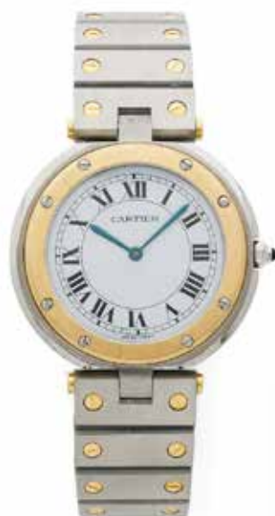
129 CARTIER Santos Ronde, No. 6191214792 Vers 1990

Montre bracelet en acier et or jaune 18k (750) Boîtier : rond, lunette en or à vis, couronne ornée d'un cabochon, fermeture à vis, signé Cadran : blanc, chiffres romains, minuterie chemin de fer, signé Mouvement : quartz Bracelet : en acier et or Boucle : déployante signée Tour de poignet : approx. 17 cm Diam. 33 mm Poids brut : 67,50 g