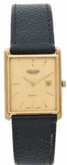
103 JAEGER No. 188706 Vers 1970

Montre bracelet en or jaune 18k (750) Boîtier : rectangulaire, fond clippé, numéroté Cadran : doré, index « bâton » appliqués, date à guichet, signé Jaeger Paris Mouvement : quartz Dim. 31 x 25 mm Poids brut : 28,00 g