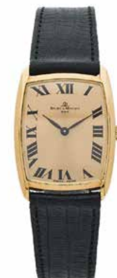
133 BAUME & MERCIER No. 400618 et 37061 Vers 1960

Montre bracelet en or 18k (750) Boîtier : rectangulaire, fond clippé, signé Cadran : doré rayonnant avec index chiffres romains peints, signé Mouvement : mécanique, 17 rubis, signé Boucle : ardillon, en métal doré, siglée Dim. 25 x 33 mm Poids brut : 25,31 g