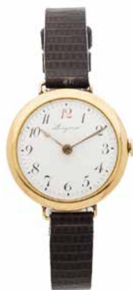
138 LONGINES No. 2264213 Vers 1920

Montre bracelet de dame en or jaune 18k (750) Boîtier : rond, fond fermeture à pression, signé Cadran : émail blanc avec chiffres arabes stylisés, signé Mouvement : mécanique, signé Diam. 28 mm Poids brut : 23,55 g