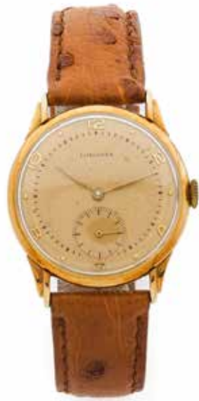
135 LONGINES No. 5653 et 199 Vers 1960

Montre bracelet en or jaune 18k (750) Boîtier : rond, fond clippé, signé et numéroté Cadran : doré deux tons avec index appliqués, minuterie chemin de fer, compteur pour les secondes à 6h, signé Mouvement : mécanique, signé et numéroté Diam. 33 mm Poids brut : 35,91 g