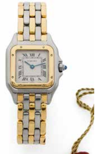
25 CARTIER Panthère PM, réf. 166921, No. 054024 Vers 1990

Montre bracelet de dame en acier et or jaune 18k (750) Boîtier : coussin, lunette en or à vis, couronne de remontoir ornée d'un cabochon, fermeture à vis, signé Cadran : crème, chiffres romains, minuterie chemin de fer, signé Mouvement : quartz Bracelet : en or et acier Boucle : déployante signée