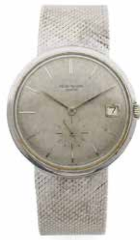
21 PATEK PHILIPPE Réf. 3445 Mouvement No. 1123568 Boitier No. 318152 Vers 1970

Montre bracelet en or blanc 18k (750) Boîtier : rond, fond vissé, remontoir avec logo, clé de fabricant 4, signé Cadran : argenté aux motifs écorces, aiguilles et index bâtons, petite trotteuse et date à guichet, signé Mouvement : automatique avec masse oscillante, estampillé du poinçon de Genève, calibre 27-460 M, balancier Gyromax, 27 rubis, ajusté 5 positions, signé Bracelet / Fermeture : rapporté en or blanc 18k (750), non signé