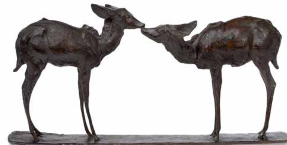
REMBRANDT BUGATTI (1884-1916) Petites antilopes koudous (caresse) Bronze à patine brun-roux Vendu 197 600€