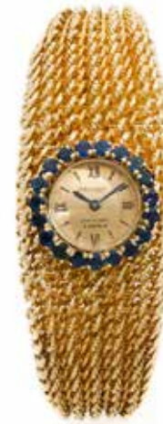
23 JAEGER LECOULTRE REVENDEUR PAR VAN CLEEF & ARPELS No. 133940 / 79481 Vers 1950

Montre bracelet de dame en or jaune 18k (750) et saphirs Boîtier : rond, lunette sertie de 19 saphirs, couronne de remontoir au dos, numéroté et signé « Van Cleef & Arpels » Cadran : doré, chiffres romains et index « bâton », double signature « Jaeger Lecoultré - Van Cleef & Arpels » Mouvement : mécanique, signé Jaeger Lecoultré