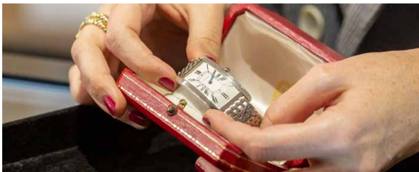
Cartier, Tank cintrée. Vendue 148 000 € en décembre 2023