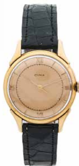
130 CYMA No. 6513 Vers 1960

Montre bracelet en or 18k (750) Boîtier : rond, fond clippé, poinçon de garantie français Cadran : saumon avec minuterie chemin de fer graduation 1/5° de seconde, index appliqués et trotteuse centrale, signé Mouvement : mécanique, 15 rubis, signé Boucle : en métal doré, non signée Diam. 32 mm Poids brut : 34,03 g