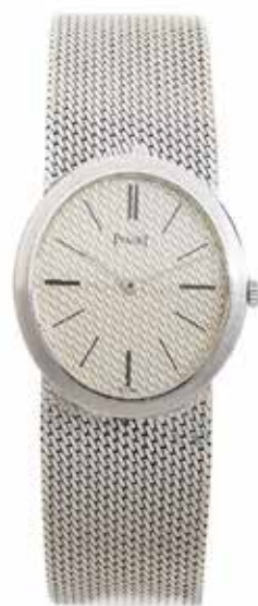
77 PIAGET Réf. 9821 811, No. 148366 Vers 1968

Montre-bracelet de dame en or blanc 18k (750) Boîtier : ovale, fermeture à vis, signé Cadran : or à effet maille milanaise, index « bâton », signé Mouvement : mécanique, signé Bracelet : maille milanaise en or, intégré au boîtier, fermoir signé Tour de poignet : approx. 17 cm Dim. 27 x 23 mm Poids brut : 52,00 g Cette référence fut produite exclusivement entre 1968 et 1979